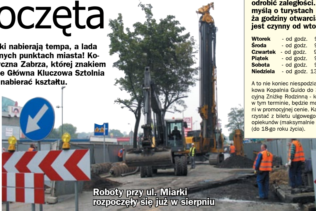
Roboty przy ul. Miarki rozpoczęły się już w sierpniu

Szyb „Wyzwolenie” zostanie udrożniony do głębokości 40 metrów, czyli poziomu, który umożliwi dostęp do 200-metrowego chodnika prowadzącego do