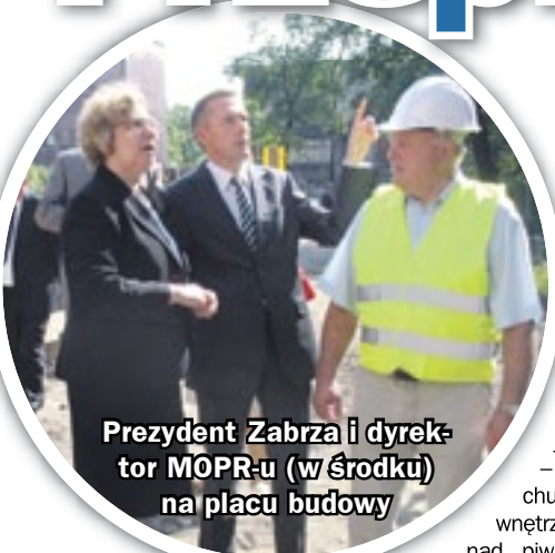
Prezydent Zabrze i dyrektor MOPR-u (w środku) na placu budowy

Gotowe są już fundamenty dobudowywanej części gmachu