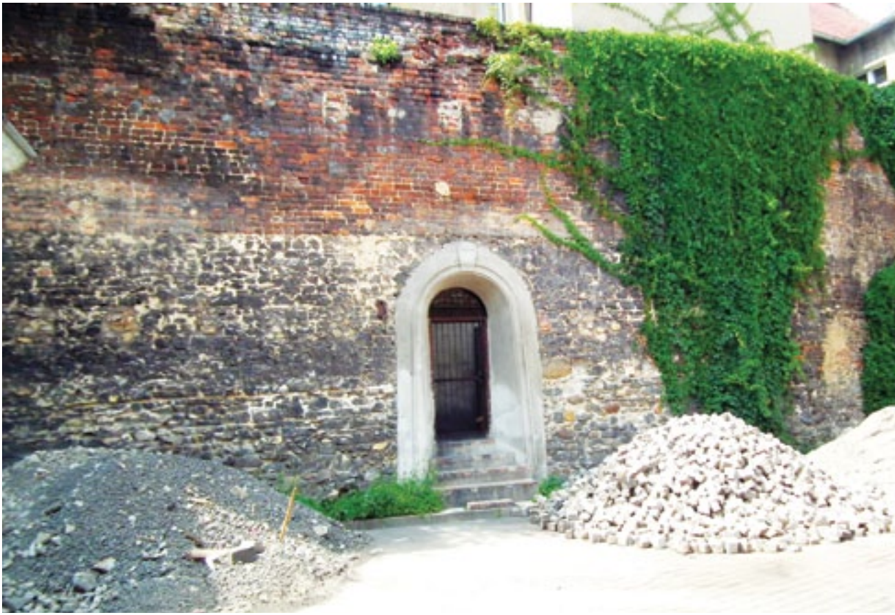
Fot. Lukasz Gawin