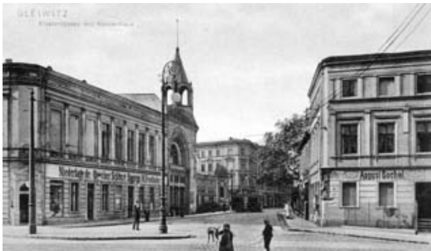
Nieistniejący już kompleks rozrywkowy „Stadtgarten”

Przechadzając się w pobliżu placu Mickiewicza w Gliwicach, można odnieść wrażenie, że miejsce to niewiele zmieniło się od czasów przedwojennych. Przeciętny przechodzień mógłby domniemywać, iż wcześniej skwerek zdołał pomieścić pomnik innego wielkiego człowieka, zapewne niemieckiego pochodzenia, usunięty jednak przez PRL-owskie władze w procesie „odniemczania” miasta tuż po II Wojnie Światowej.