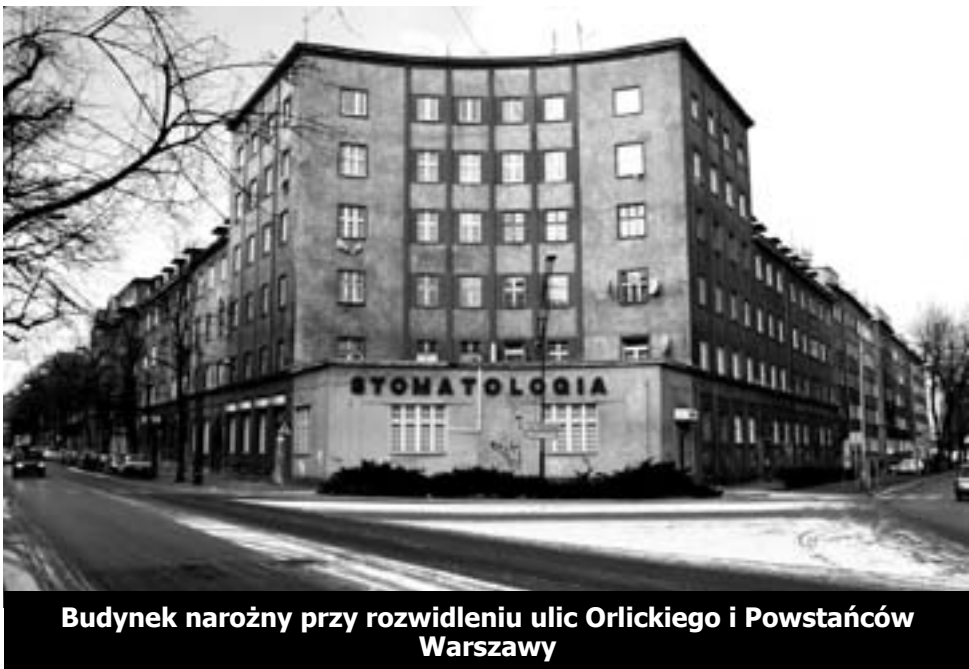
Budynek narożny przy rozwidleniu ulic Orlickiego i Powstańców Warszawy