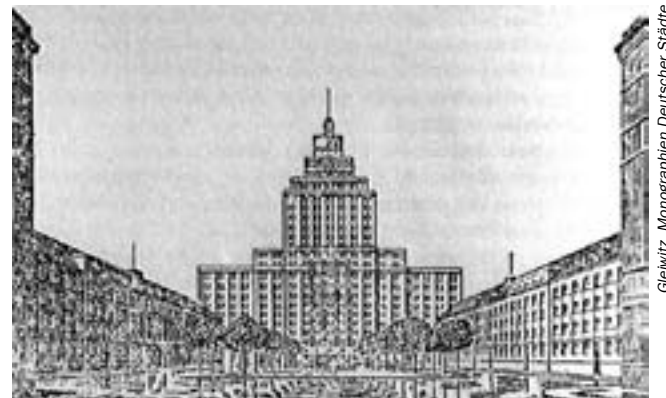
Jeden z projektów nowego ratusza w Gliwicach

w konkursie. W tym czasie nie istnieje jeszcze hotel Haus Oberschlesien (dzisiejszy magistrat), dlatego część z propozycji konkursowych właśnie tam lokalizuje nowy ratusz. Ostatecznie zapada decyzja, że w tym miejscu zostanie wybudowany hotel, natomiast nowy urząd miasta powstanie na zamknięciu tzw. osi Schabi-