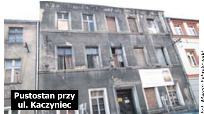
Pustostan przy ul. Kaczyńiec

Opuszczonej części budynku nie można wyburzyć, bo stanowi podparcie dla pozostałej części budowli. Nie opłaca się go także remontować, bo pochłonęłoby to ogromne pieniądze.