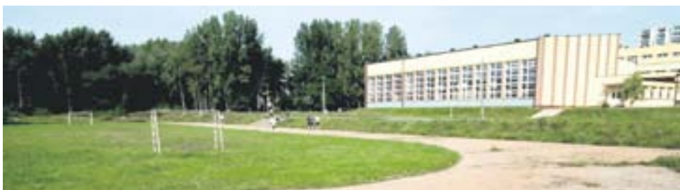
Czy przy Zespole Szkół Ogólnokształcąco-Ekonomicznych powstanie długo wyczekiwana arena lekkoatletyczna z prawdziwego zdarzenia?