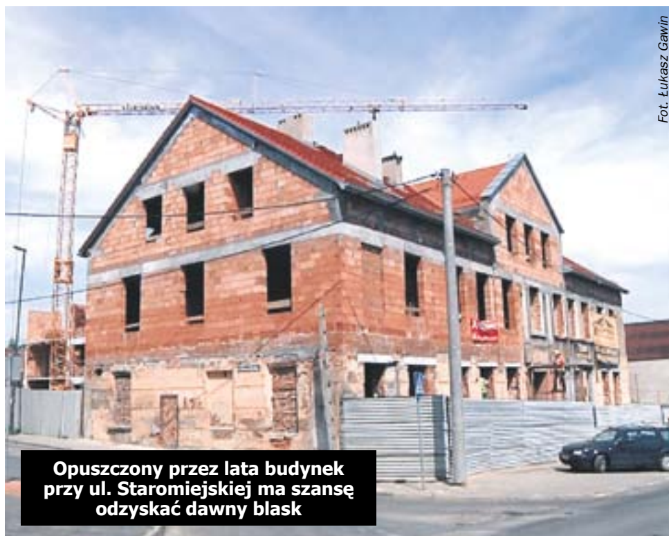
Opuszczony przez lata budynek przy ul. Staromiejskiej ma szansę odzyskać dawny blask

Niektóre z pustostanów są z inicjatywy właściciela wyburzane. W ostatnich latach zniknęło w ten sposób 40 takich obiektów.