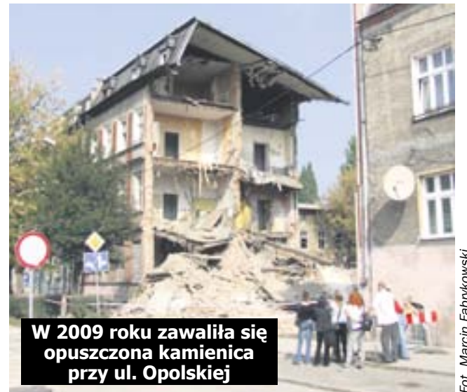
W 2009 roku zawaliła się opuszczona kamienica przy ul. Opolskiej

Przykładem budynku, który od lat świecił pustkami jest obiekt na rogu ulic Staromiejskiej i Rzczyckiej w Łąbędach. Teraz przechodzi metamorfozę.