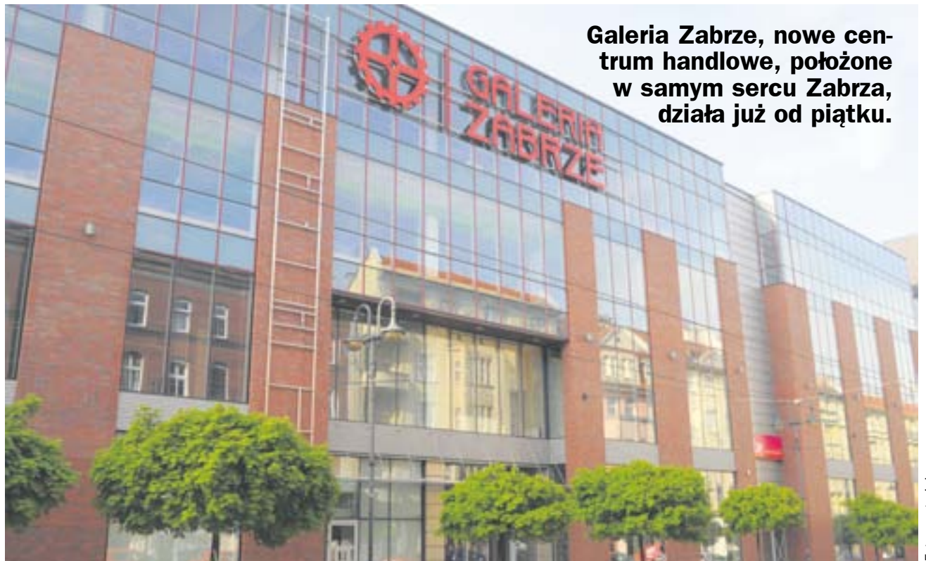
Galeria Zabrze, nowe centrum handlowe, położone w samym sercu Zabrze, działa już od piątku.