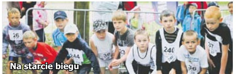
Na starcie biegu

W 2012 roku w wydarzeniach artystycznych realizowanych na scenach GTM uczestniczyło ponad 173 tys. osób.