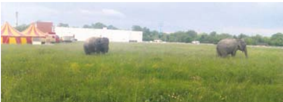
Słonie spacerujące po... łące przy Parku Handlowym Arena. Ten niecodzienny widok zarejestrował jeden z naszych Czytelników.