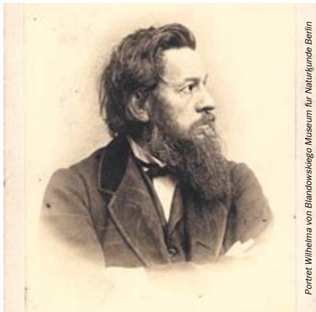
Portret Wilhelma von Blandowskiego.

Jego żywot to trochę żywot szaleńca, ale dzięki niemu możemy teraz przenieść się w czasie o 150 lat. O kim mowa? O Wilhelmie von Blandowskim - znakomitym gliwickim fotografie i... kontrowersyjnym, ekscentrycznym człowieku. Wystawę jego zdjęć można już oglądać w Czytelni Sztuki w Gliwicach, przy ul. Dolnych Wałów 8a.