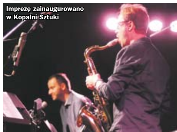
Imprezę zainaugurowano w Kopalni Sztuki

Przez dwa dni miłośnicy jazzowych brzmień mieli w Zabrze prawdziwą ucztę dla ducha. W mieście odbyła się bowiem 19. już edycja JAZZ Festiwalu Muzyki Improwizowanej.