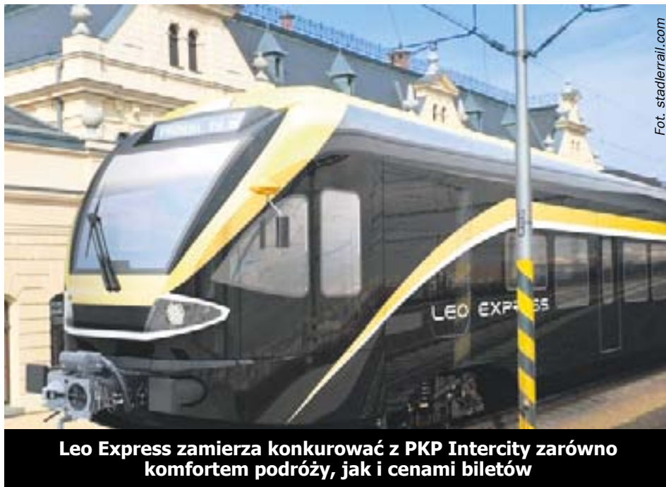
Leo Express zamierza konkurować z PKP Intercity zarówno komfortem podróży, jak i cenami biletów

Wciąż trwają rozmowy z PKP Polskie Linie Kolejowe w sprawie przyznania firmie tras.