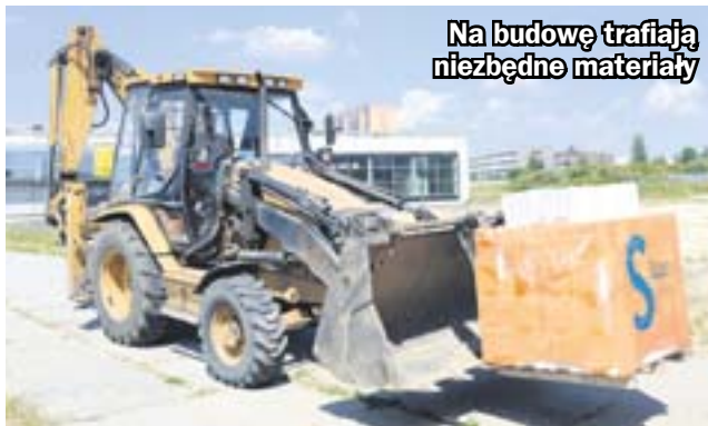
Na budowę trafiają niezbędne materiały