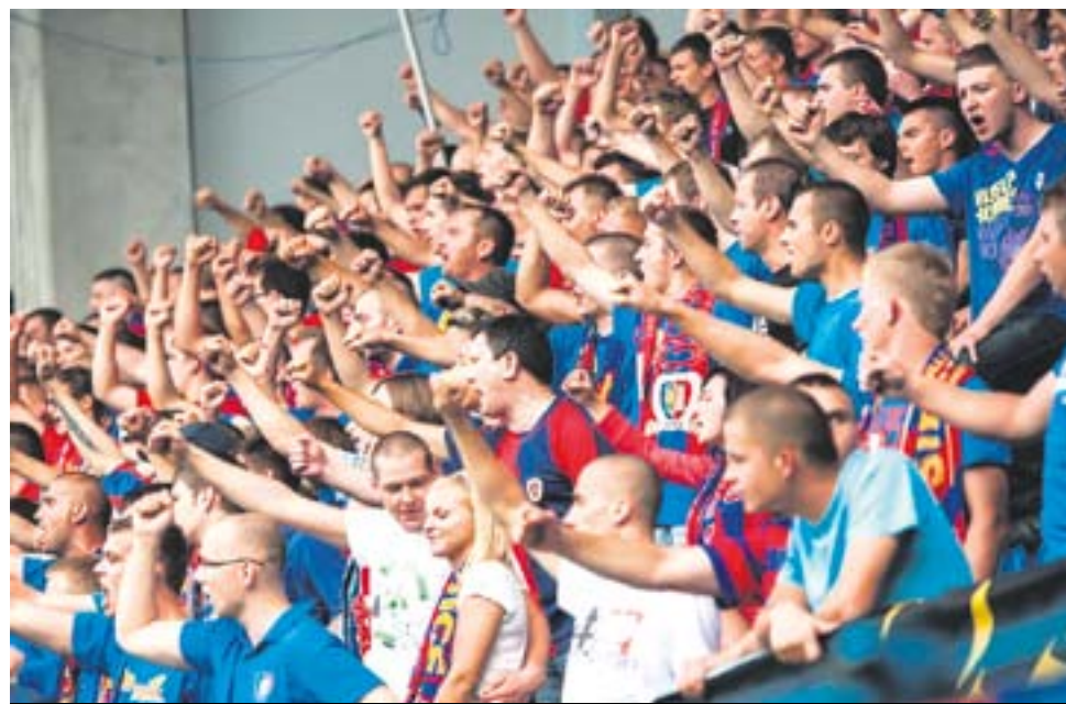
Kibice stworzyli wspaniałą atmosferę podczas czwartkowego meczu