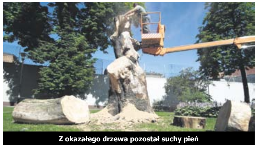
Z okazałego drzewa pozostał suchy pień

jednym z sześciu gliwickich pomników przyrody. Tego typu drzewa z reguły osiągną wiek 300 lat. (mpp)