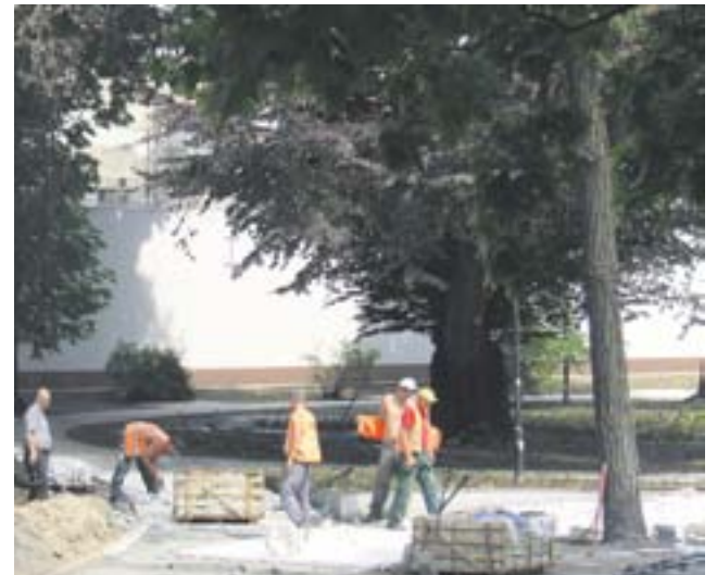
Kwiecień 2010 roku. Wtedy jeszcze nikt nie podejrzewał, że trzy lata później pomnik przyrody będzie musiał być ścięty

Na początku kwietnia, na wniosek prezydenta miasta, radni przyjęli uchwałę o wycofaniu statusu pomnika przyrody dla drzewa, głównie ze względów bezpieczeństwa. „W związku z zaawansowanym procesem zamierania drzewa i związaną z tym utratą wartości przyrodniczych oraz koniecznością zapewnienia bezpieczeństwa powszechnego, drzewo należy