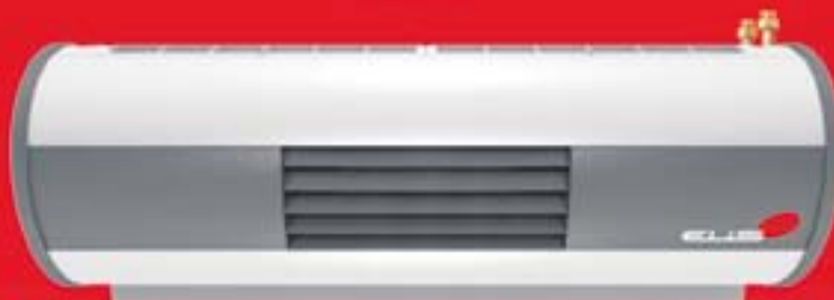
Kurtyno-nagrzewnica – dwa niezależne moduły zabudowane w jednym urządzeniu. ELIS DUO jest jedynym urządzeniem na rynku, które zapewnia barierę otworu drzwiowego przy jednoczesnym ogrzewaniu pomieszczenia