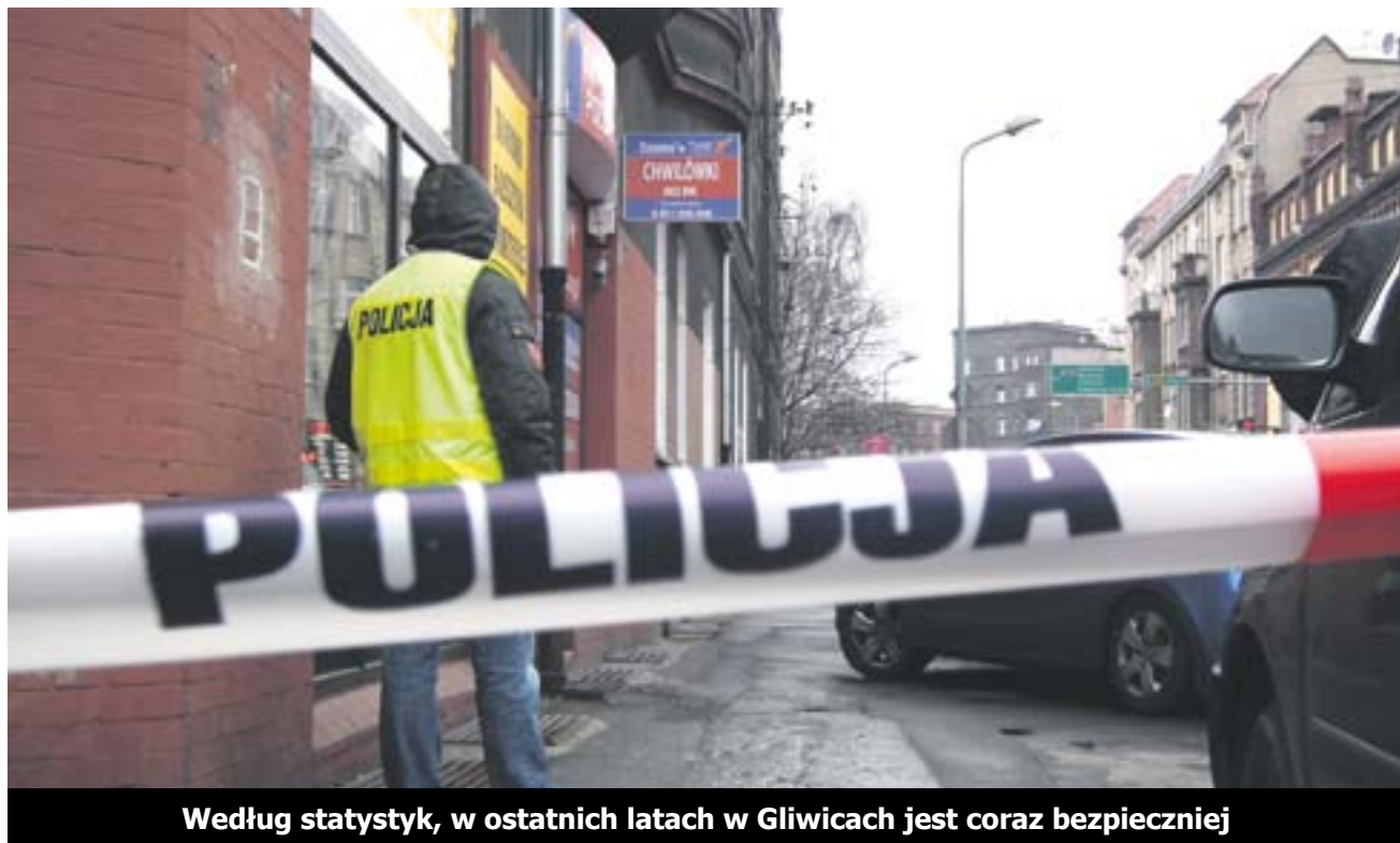
Według statystyk, w ostatnich latach w Gliwicach jest coraz bezpieczniej

Drugą, najbardziej niebezpieczną dzielnicą miasta jest Zatorze (322 naruszeń prawa), a dalej Szobiszowice (215) i Sośnica (178). Gdy przeliczymy ilość przestępstw na liczbę mieszkańców w dzielnicach, do wymienionej czwórki dołączają także rejony Ligoty Zaborskiej i Trynku.