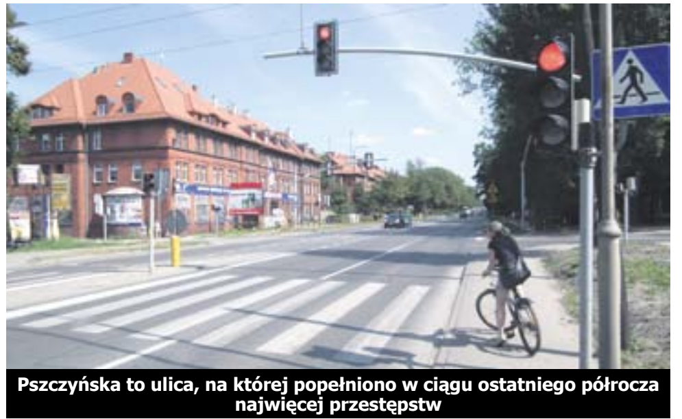
Pszczyńska to ulica, na której popełniono w ciągu ostatniego półrocza najwięcej przestępstw

Po drugiej stronie szali znajdują się Brzezinka, Wilcze Gardło, Czechowice i Wójtowa Wieś, gdzie do końca czerwca nikt nie stracił samochodu.