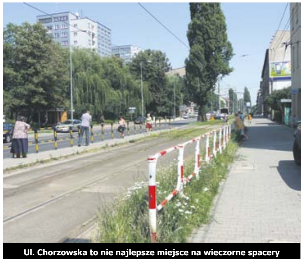
Ul. Chorzowska to nie najlepsze miejsce na wieczorne spacery