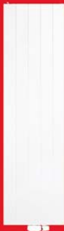
Stelrad Vertex Style Grzejnik z gładkim panelem i stylowymi przetłoczeniami

NOWOCZESNE SYSTEMY GRZEWCZE, SANITARNE, GAZOWE I WENTYLACYJNE