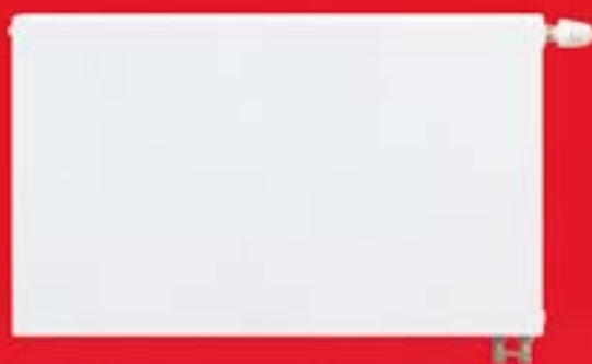
Stelrad Planar - grzejnik dekoracyjny z gładkim panelem czołowym