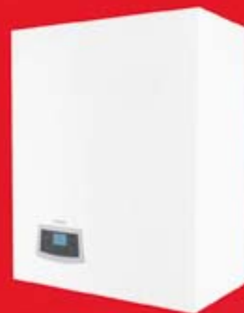
KOCIOŁ TERMET Ecocondens Integra 20 lub 25 Wiszące kotły kondensacyjne z wbudowanym 45 litrowym zasobnikiem