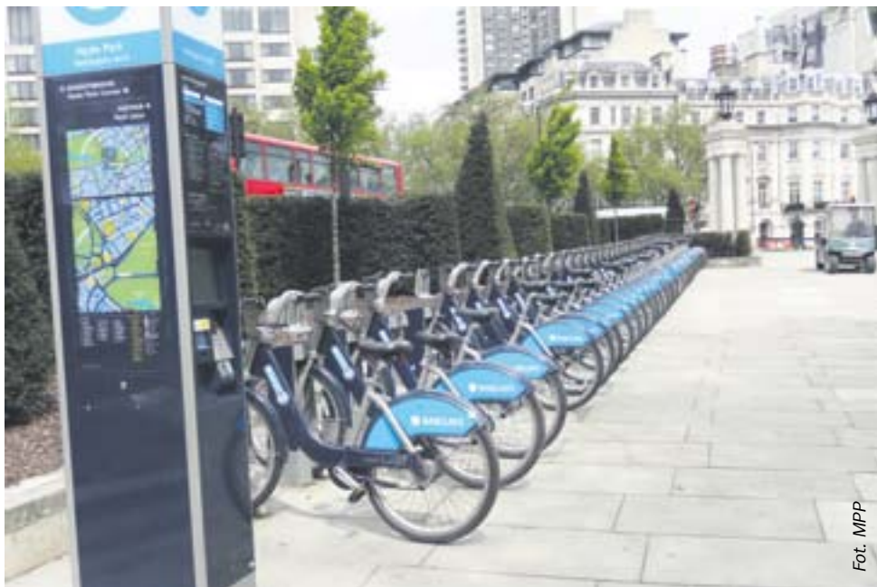
Wypożyczalnia rowerów miejskich z powodzeniem funkcjonują w państwach Europy. Na zdjęciu wypożyczalnia w centrum Londynu