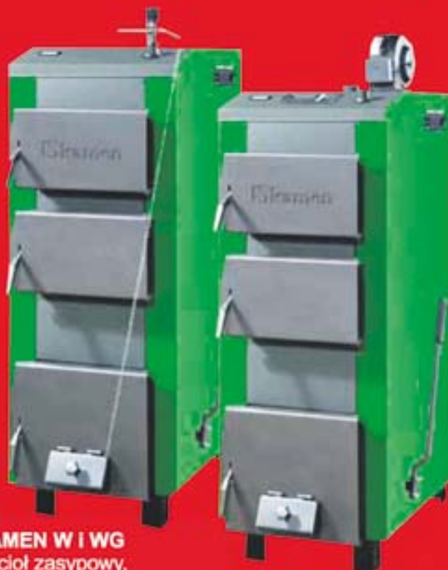
KAMEN W I WG Kocioł zasypowy, dwpaleniskowy