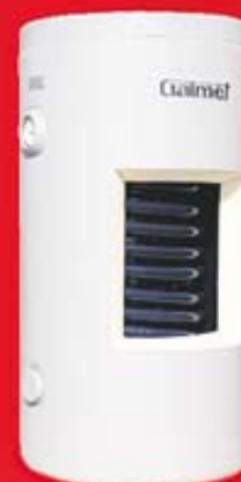
GALMET - wymienniki c.w.u. z węzownicą spiralną, wolnostojące, pionowe o pojemności od 100 do 140 litrów