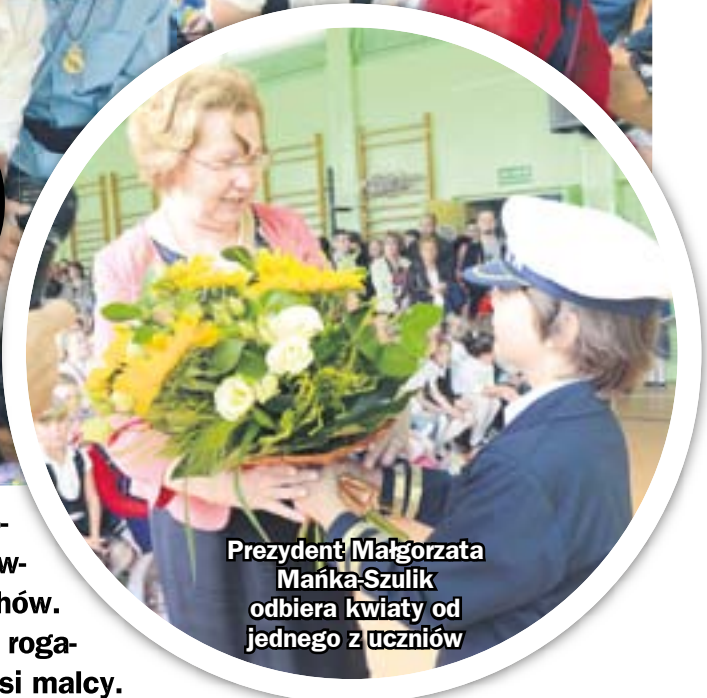
Prezydent Małgorzata Mańka-Szulik odbiera kwiaty od jednego z uczniów

Dla ponad 23 tysięcy uczniów zabrzańskich szkół rozpoczął się w tym tygodniu nowy rok szkolny. Po raz pierwszy w szkolnych ławkach zasiadło 1,6 tysiąca maluchów. Tym razem to jeszcze głównie siedmiolatkowie. Za rok z rogami obfitości wkroczą w szkolne mury już o rok młodszy malcy.