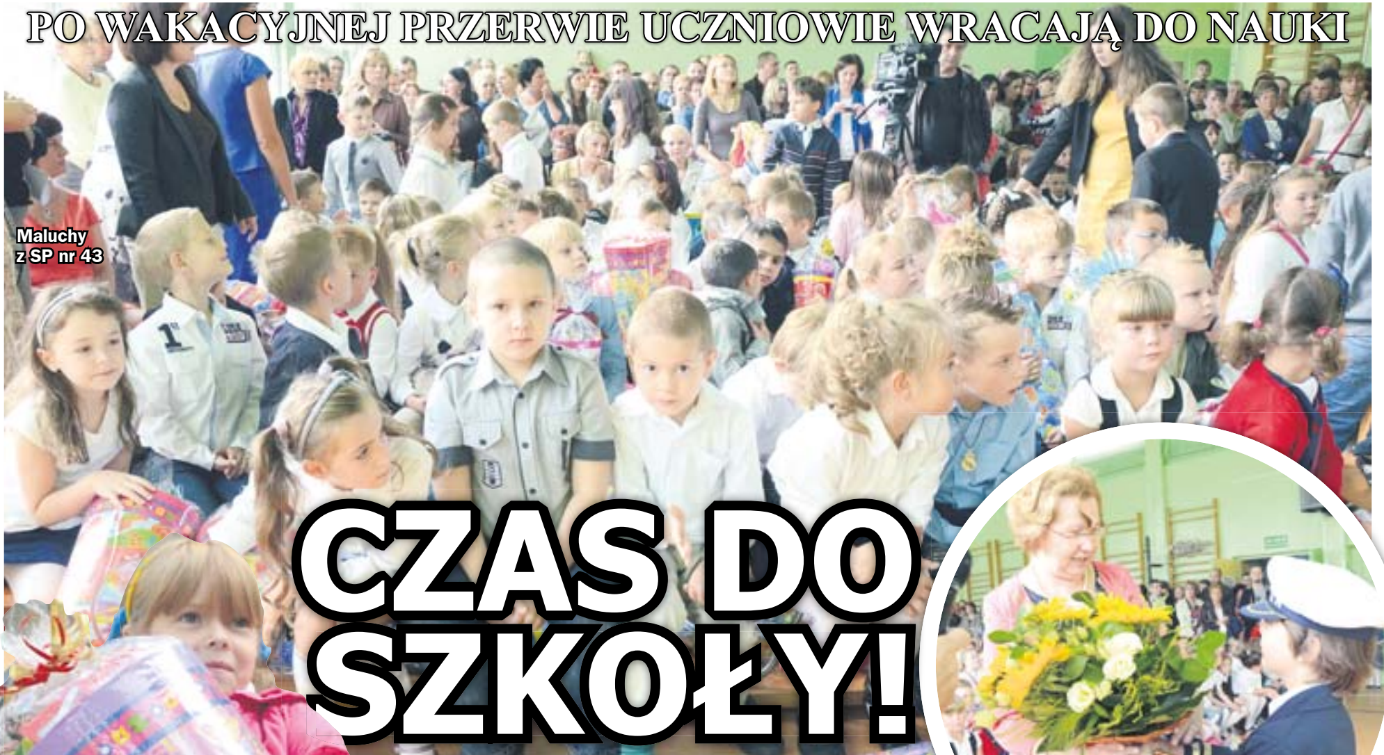
Maluchy z SP nr 43