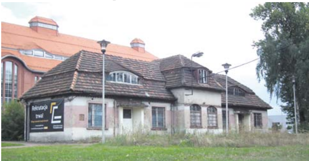
Według pierwszych zamierzeń, w zabytkowym budynku miał powstać lokal gastronomiczny

Zaniedbany budynek „Stacji” od lat szpeci pięknie odrestaurowane budynki po kopalni. Nowy właściciel chciał tutaj postawić biurowiec, jednak sprzeciw konserwatora zabytków zatrzymał wyburzenie budynku. Teraz obiekt niszczeje, a właściciel szuka sposobu by się go pozbyć.