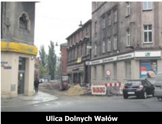
Ulica Dolnych Wałów