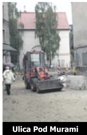
Ulica Pod Murami

Gruntowna modernizacja uliczek gliwickiej Starówki rozpoczęła się w 2011 roku, a jej koszt to ponad 41 mln zł. (kk)