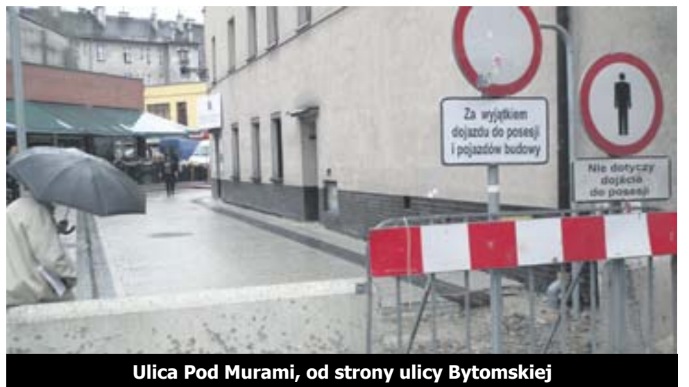
Ulica Pod Murami, od strony ulicy Bytomskiej