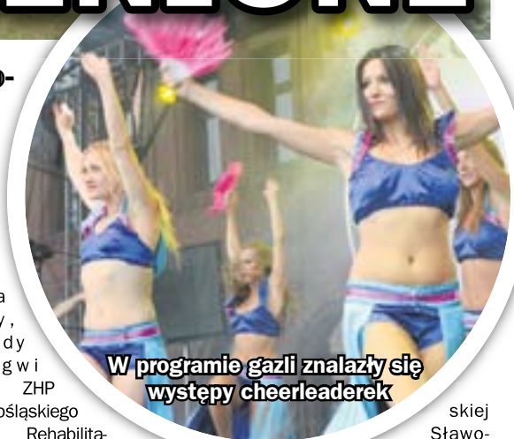
W programie gali znalazły się występy cheerleaderek