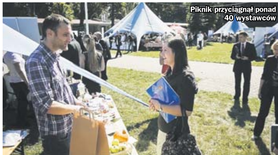
Piknik przyciągnął ponad 40 wystawców

Centrum Rozwoju Przedsiębiorczości . W jego siedzibie czynne są m.in. stanowiska Zakładu Ubezpieczeń Społecznych, Urzędu Skarbowego i Powiatowego Urzędu Pracy. Dzięki temu w jednym miejscu można załatwić formalności związane z założeniem działalności gospodarczej i uzyskać kompleksowe informacje i pomoc w zakresie jej prowadzenia. Centrum działa w budynku Głównej Kluczowej Sztolni Dziedzicznej przy ul. Miarki . (hm)