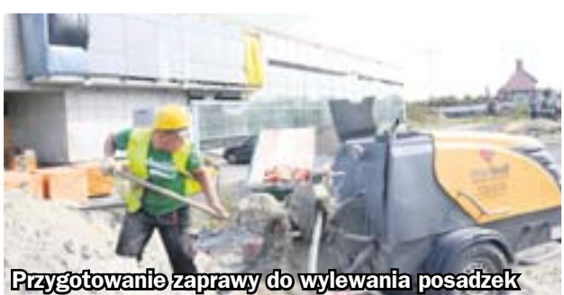
Przygotowanie zaprawy do wylewania posadzek

W najbliższych dniach do metalowych uchwytów będą montowane panele z tworzywa