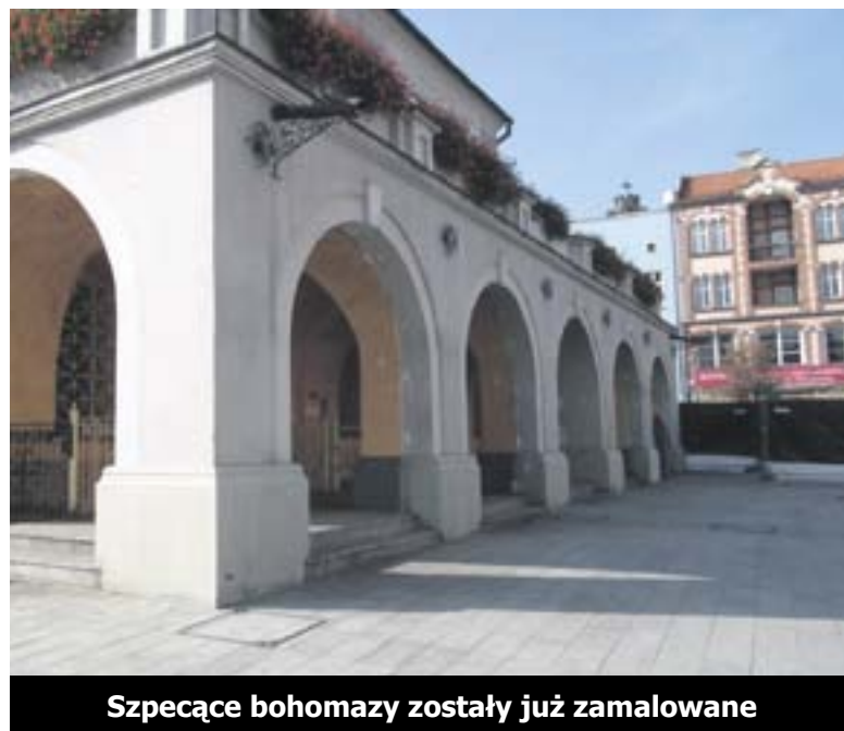
Szpecące bohomazy zostały już zamalowane

pozytywnie zaskakująca aktywność konserwatorska, to zasługa m.in. naszych publikacji. Nie jest zresztą to istotne. Ważne, że serce miasta powraca do stanu, który pozwala przejść gliwicką starówką bez zgrzytania zębami.