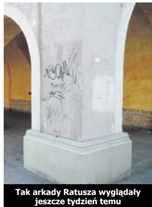
Tak arkady Ratusza wyglądały jeszcze tydzień temu