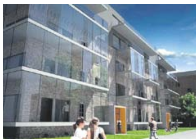
Wizualizacja ING Real Estate

– Mamy pozwolenie na budowę, dotyczące określonego planu osiedla Glivia. Jeśli zainteresowane podmioty będą chciały od razu rozpocząć budowę, to jest to możliwe, ale