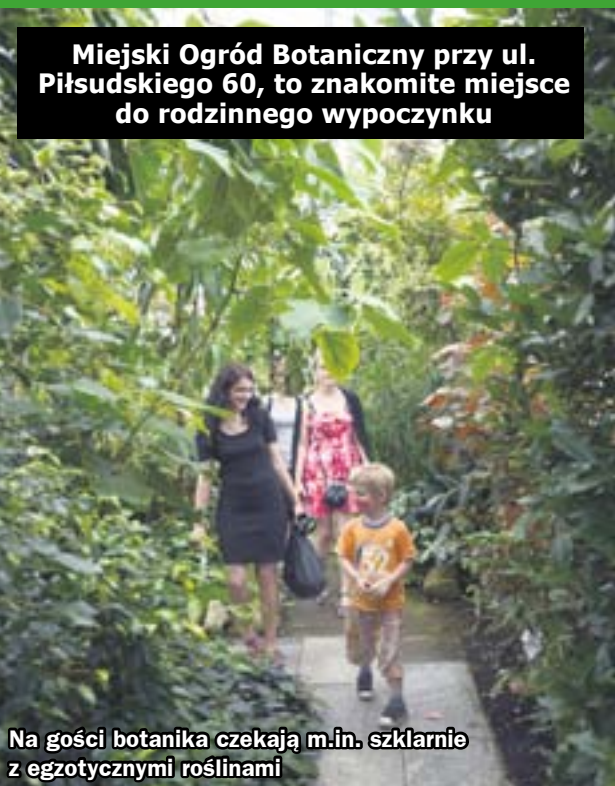
Na gości botanika czekają m.in. szklarnie z egzotycznymi roślinami

Ogród czynny jest od poniedziałku do soboty w godzinach od 11 do 19, a w niedziele i święta od 10 do 19. Bilet normalny kosztuje 2 zł, a ulgowy – 1 zł. Na 50-procentową zniżkę mogą liczyć rodziny uczestniczące w programie „Rodzina na 5+”. (hm)