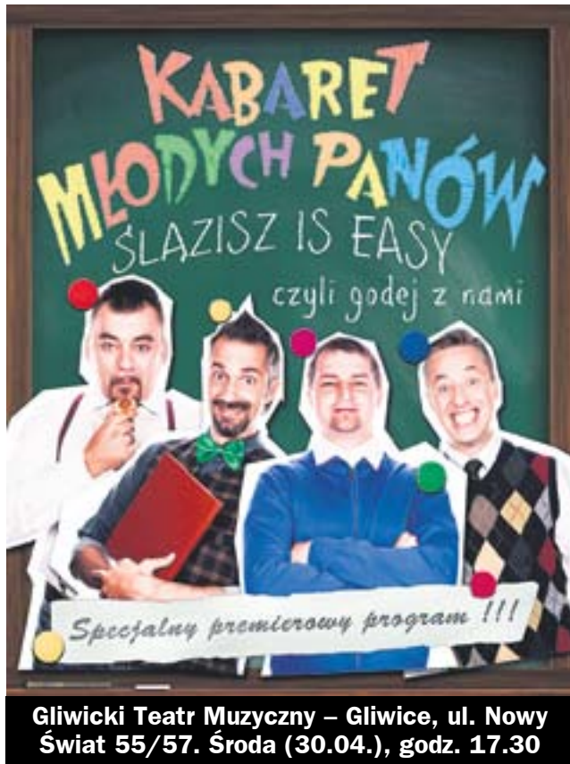
Gliwicki Teatr Muzyczny – Gliwice, ul. Nowy Świat 55/57. Środa (30.04.), godz. 17.30

Galeria „9” (Filia MBP nr 9) – ul. Czwartków 18, Gliwice.