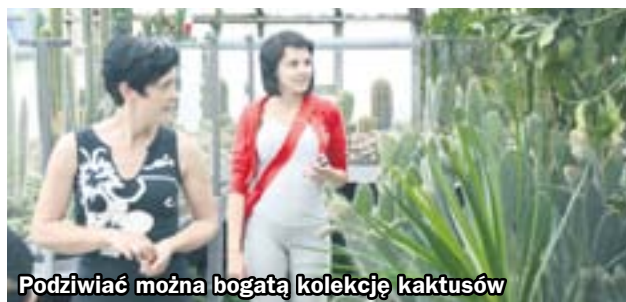
Podziwiać można bogatą kolekcję kaktusów