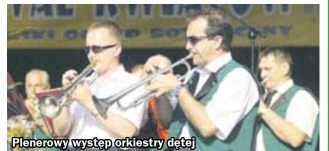
Plenerowy występ orkiestry dętej