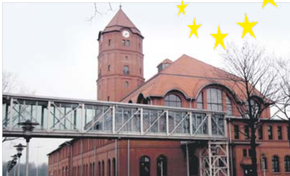
Dzięki funduszom unijnym udało się wybudować Centrum Edukacji i Biznesu Nowe Gliwice

W maju 2012 roku Komisja Europejska orzekła, że wy-