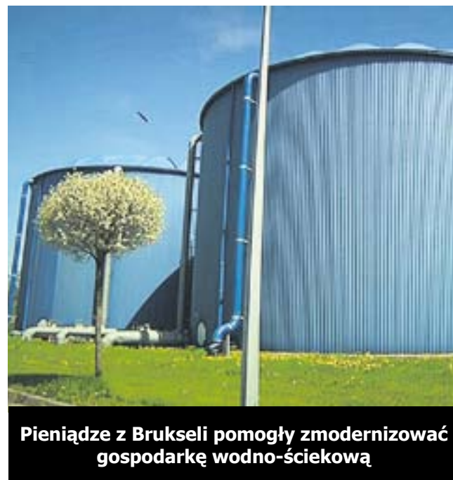
Pieniądze z Brukseli pomogły zmodernizować gospodarkę wodno-ściekową