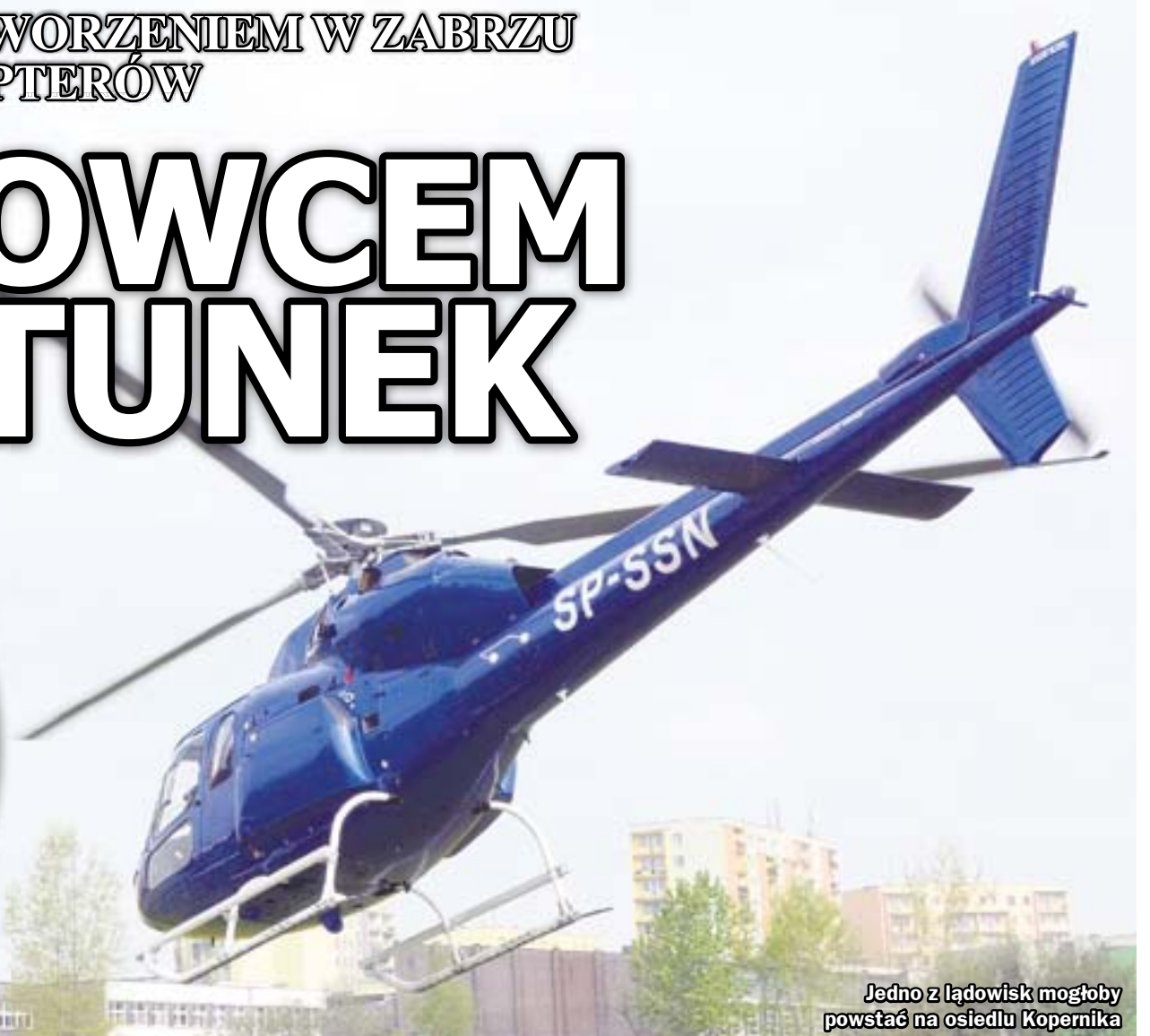
Jedno z lądowisk mogłoby powstać na osiedlu Kopernika

Powstałyby głównie z myślą o śmigłowcach Lotniczego Pogotowia Ratunkowego, ale docelowo mogłoby z nich korzystać również odwiedzający Zabrze biznesmeni i turyści. O możliwych lokalizacjach lądowisk dla helikopterów rozmawiali z przedstawicielami zabrzańskiego samorządu eksperci Politechniki Śląskiej oraz Centrum Kształcenia Kadr Lotnictwa Cywilnego Europy Środkowo-Wschodniej. Spotkanie poprzedził wspólny przelot nad miastem.