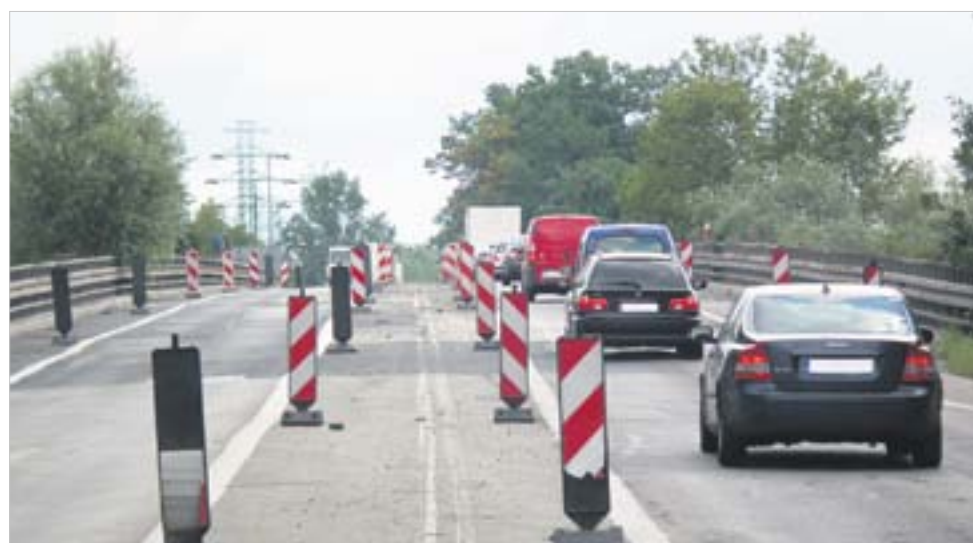
Trwająca przebudowa wiaduktu w ciągu DK88 finansowana jest ze środków unijnych

Z innych kluczowych inwestycji drogowych warto przypomnieć, że trwająca przebudowa odcinka Drogi Krajowej nr 88 w aż 85 proc. zostanie zrefundowana w ramach programu unijnego.