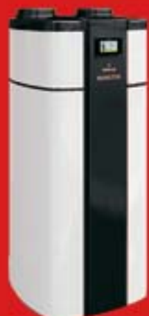
POMPA CIEPŁA GALMET SPECTRA