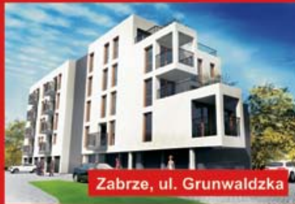
Zabrze, ul. Grunwaldzka