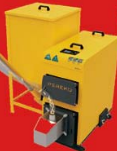
PER EKO PELLET