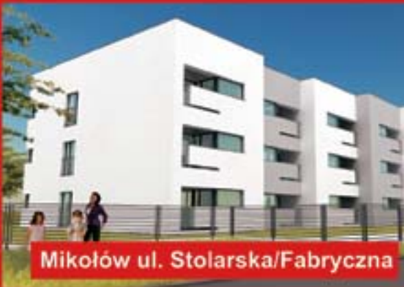
Mikołów ul. Stolarska/Fabryczna

gotowe mieszkania od 37 m 2 dobre lokalizacje - blisko parków, centrum miasta pomagamy w uzyskaniu kredytu