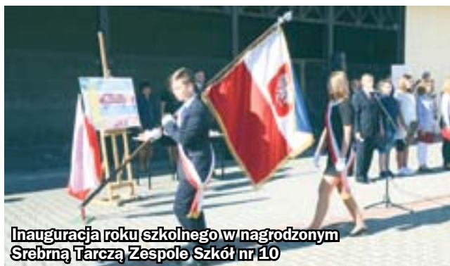
Inauguracja roku szkolnego w nagrodzonym Srebrną Tarczą Zespole Szkół nr 10