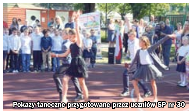
Pokazy taneczne przygotowane przez uczniów SP nr 30