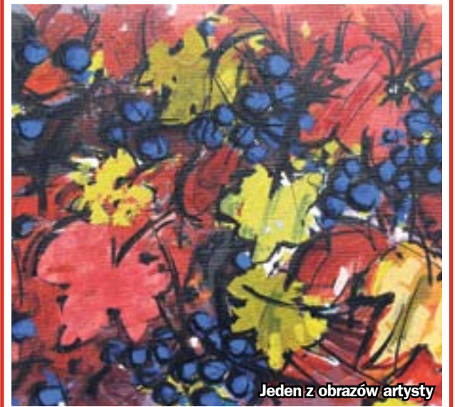
Jeden z obrazów artysty