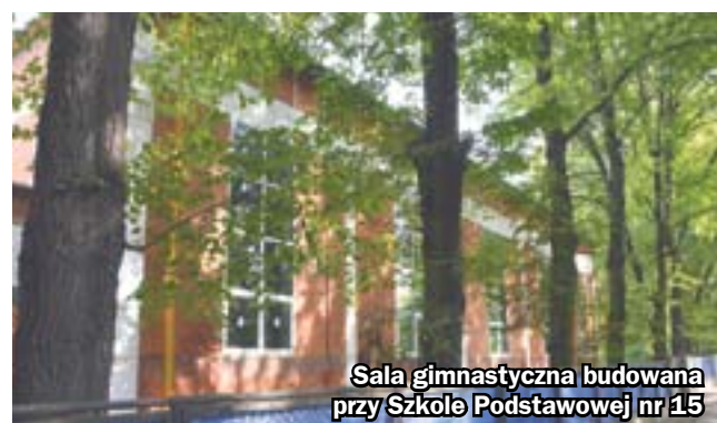
Sala gimnastyczna budowana przy Szkole Podstawowej nr 15