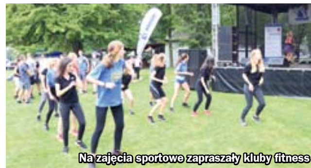
Na zajęcia sportowe zapraszały kluby fitness

Zabrzeńscy przedsiębiorcy spotkali się w piątek na Kąpielisku Leśnym w Maciejowie, by zaprezentować mieszkańcom swoją ofertę. W programie „Pikniku w rytmie firmy” znalazły się m.in. zajęcia sportowe, pokazy masażu, degustacje i atrakcje dla najmłodszych. Impreza była też okazją do zainaugurowania III Zabrzeńskiego Festiwalu Restauracji.