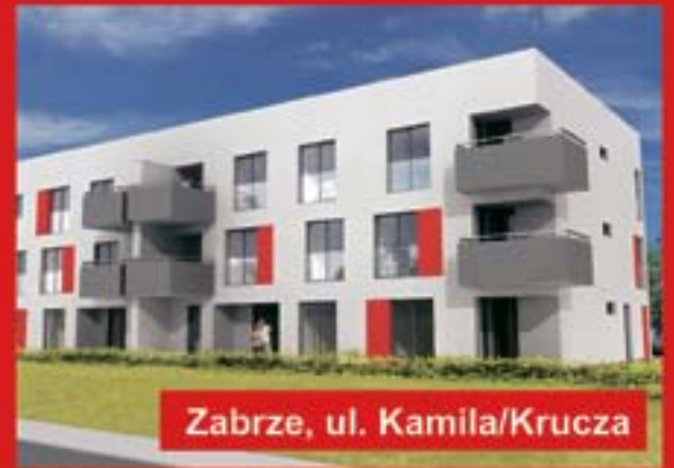
Zabrze, ul. Kamila/Krucza

gotowe mieszkania od 37 m 2 dobre lokalizacje - blisko parków, centrum miasta pomagamy w uzyskaniu kredytu