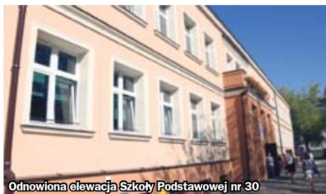
Odnowiona elewacja Szkoły Podstawowej nr 30