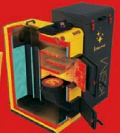
PER EKO KSM 5 klasa emisji spalin