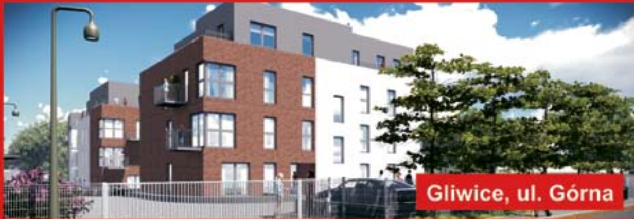
Gliwice, ul. Górna