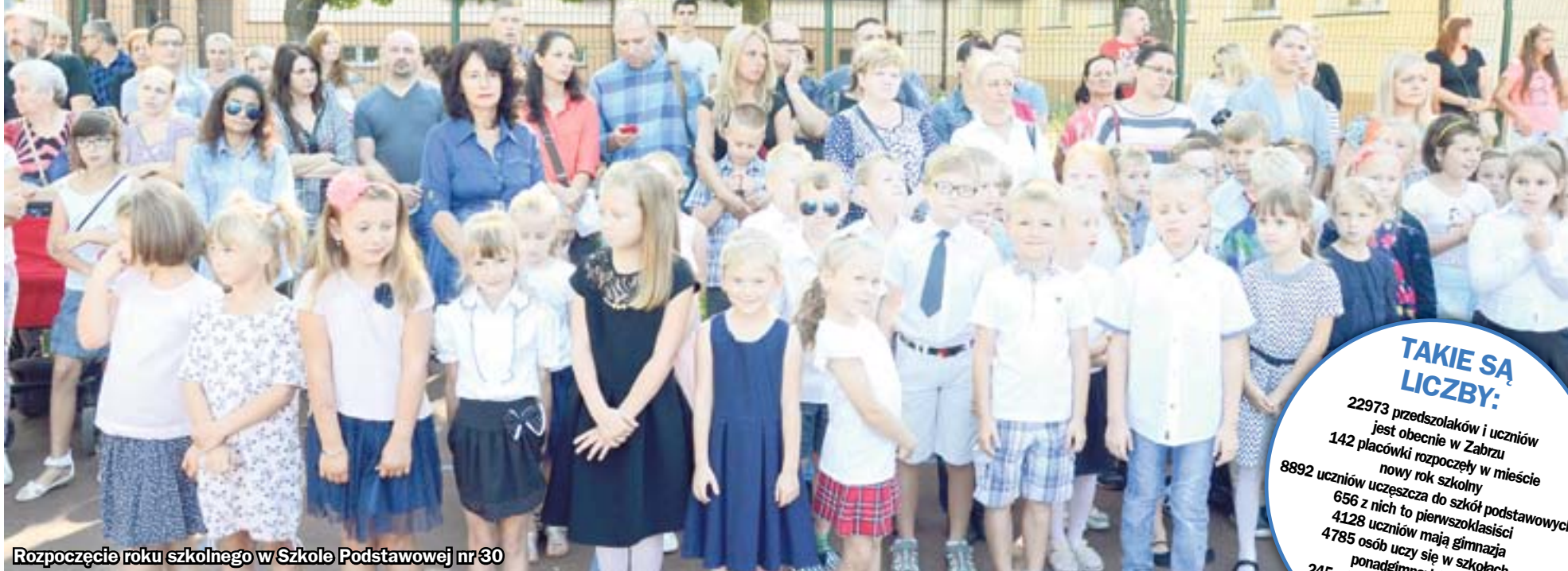
Rozpoczęcie roku szkolnego w Szkole Podstawowej nr 30