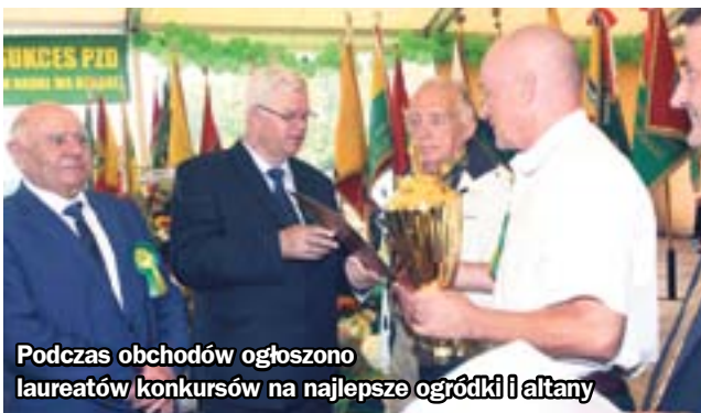
Podczas obchodów ogłoszono laureatów konkursów na najlepsze ogródki i altany

Zabrze na miejsce obchodów Krajowych Dni Działkowca oraz jubileuszu 35-lecia funkcjonowania organizacji wybrał Polski Związek Działkowców. Uroczystości odbyły się w miniony weekend w Kopalni Guido oraz na terenie Śląskiego Rancho przy ul. Webera. Do naszego miasta przyjechało około 800 działkowców z całej Polski.