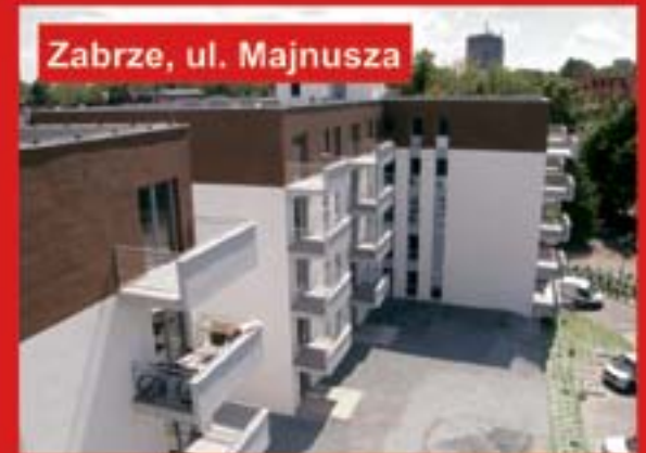
Zabrze, ul. Majnusza