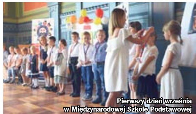
Pierwszy dzień września w Międzynarodowej Szkole Podstawowej

Prawie 2 mln zł to koszt termomodernizacji Gimnazjum nr 20 w Biskupicach. Prace ruszyły jesienią ubiegłego roku i właśnie zbliżają się do końca. Samorząd nie zapomina także o przedszkolakach. Obecnie termomodernizacje trwają m.in. w Przedszkolu nr 38 na Helence i Przedszkolu nr 45 w Mikulczycach. Budżet na tegoroczne prace termomodernizacyjne to ponad 6,6 mln zł. Nowa sala gimnastyczna powstaje z kolei w Szkole Podstawowej nr 15 przy ul. Czołgistów. Koszt prac przekroczy tu 1,7 mln zł. (hm)