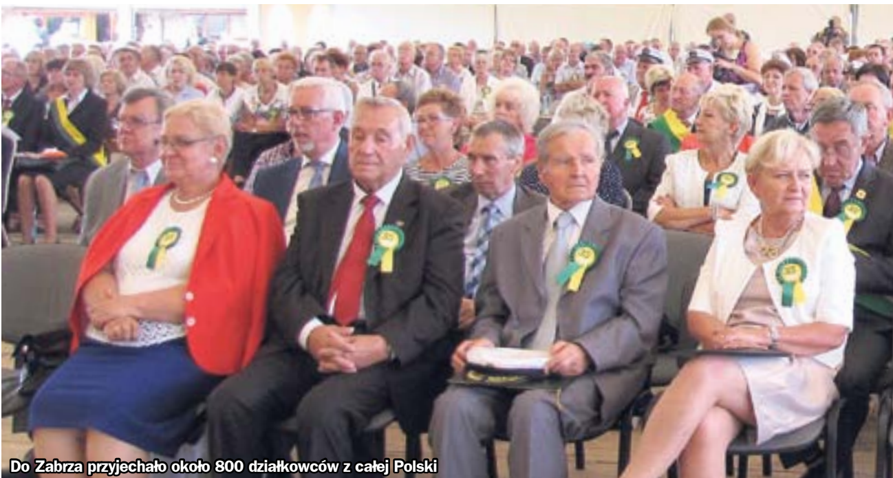
Do Zabrza przyjechało około 800 działkowców z całej Polski