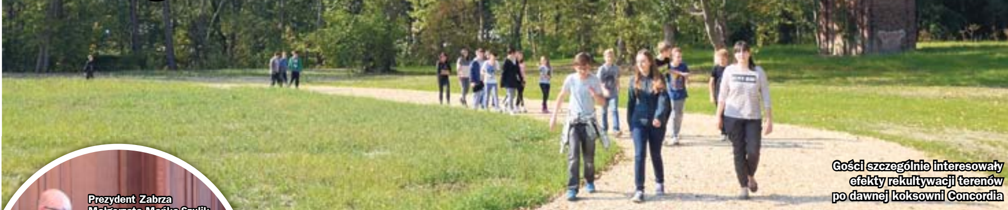
Gości szczególnie interesowały efekty rekultywacji terenów po dawnej koksowni Concordia