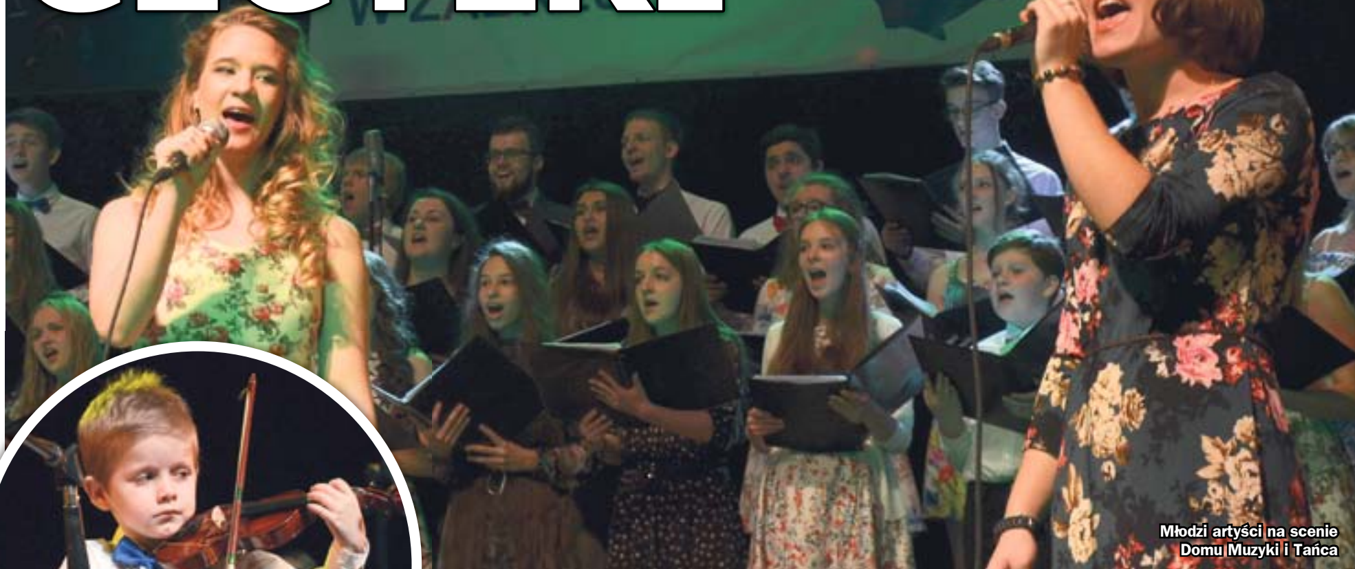
Młodzi artyści na scenie Domu Muzyki i Tańca

Wyjątkowy charakter miały zorganizowane w miniony czwartek w Domu Muzyki i Tańca tradycyjne Cecylki. Koncert ku czci św. Cecylii wpisał się bowiem w obchody jubileuszu 20-lecia Salezjańskiego Zespołu Szkół Publicznych w Zabrze.