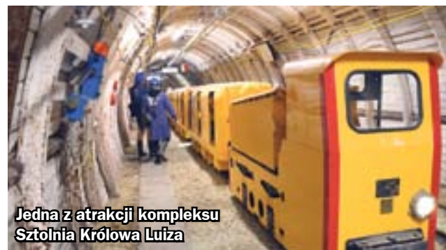
Jedna z atrakcji kompleksu Sztolnia Królowa Luiza