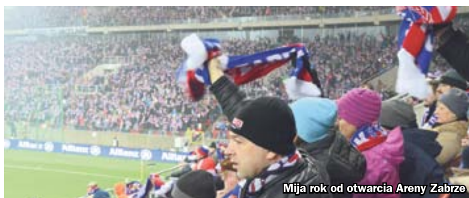
Mija rok od otwarcia Areny Zabrze

W lutym 2016 r. Wielkie Derby Śląska zobaczyło ponad 24 tysiące fanów Trójkolorowych. To pokazuje ogromny potencjał nie tylko Górnika Zabrze, ale też zabrzańskie sportu. 3 marca meczem z GKS-em Tychy zainaugurowana zostanie runda rewanżowa rozgrywek I ligi. Oprócz oferty karnetów i biletów klub przygotował specjalną propozycję „Rodzinne kibicowanie Trójkolorowym”. Szczegóły można znaleźć na stronie www.gornikzabrze.pl . (hm)