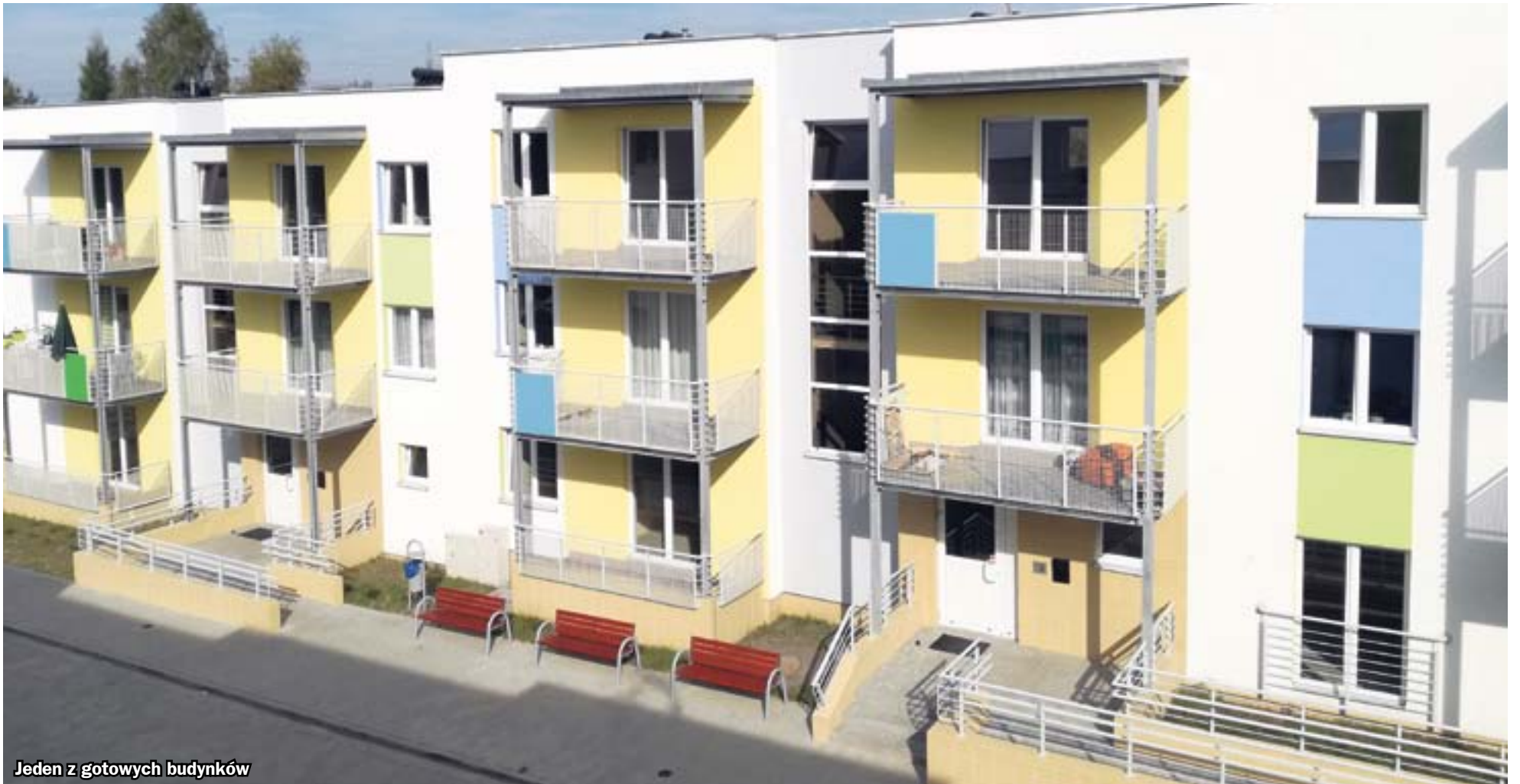
Jeden z gotowych budynków

Są nowoczesnie zaprojektowane i położone w malowniczej okolicy. Równie blisko jest stąd do autostrady A4, jak i centrum miasta. Międzygminne Towarzystwo Budownictwa Społecznego oferuje atrakcyjne mieszkania na osiedlu powstającym przy ul. Żywieckiej w Zabrze.