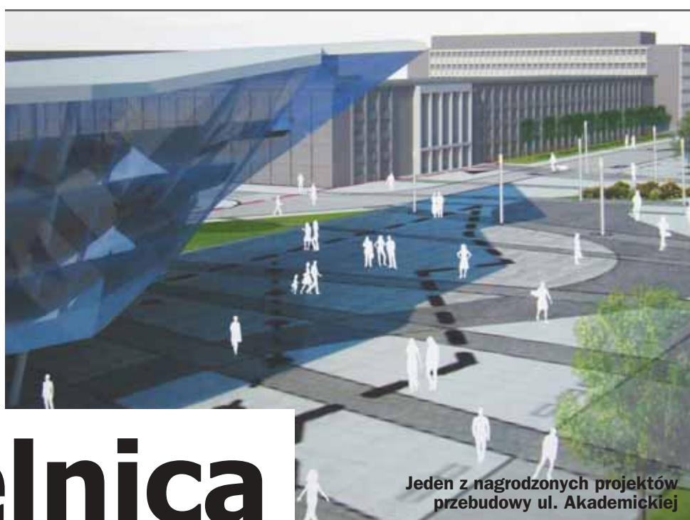
Jeden z nagrodzonych projektów przebudowy ul. Akademickiej

Czy faktycznie tak za kilka lat będzie wyglądało serce Dzielnicy Akademickiej? Władze uczelni zapowiadają, że taki właśnie projekt ma duże szanse na realizację.