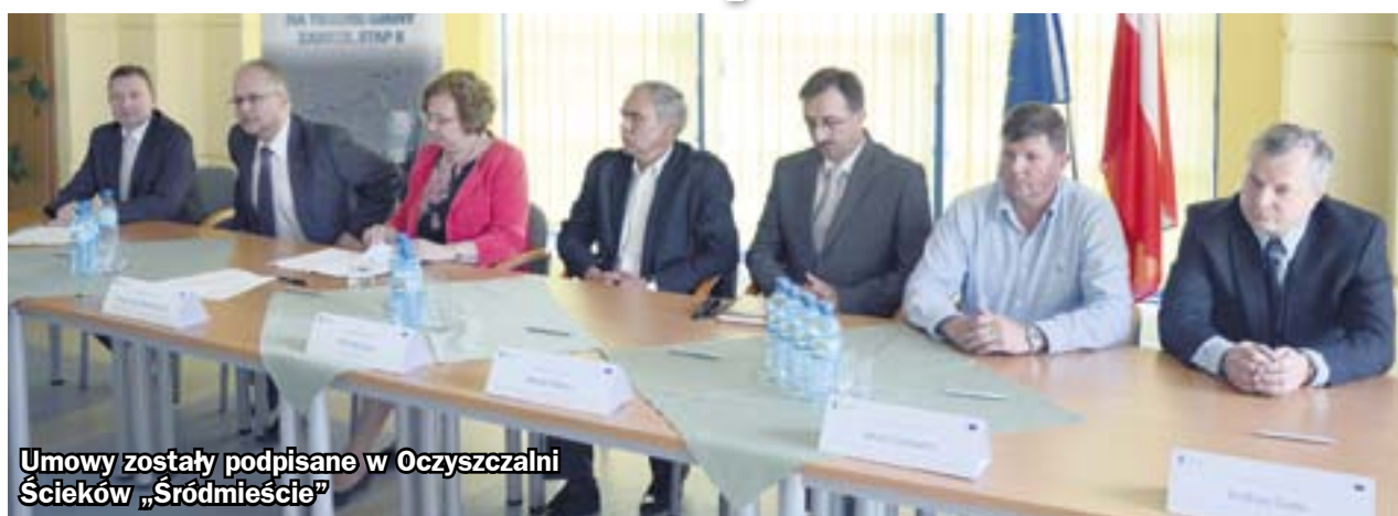
Umowy zostały podpisane w Oczyszczalni Ścieków „Śródmieście”

Kontrakty w Biskupicach i Makoszowach nie miały do tej pory szczęścia. Zaplanowane w ramach II etapu poprawy gospodarki wodno-ściekowej prace w obu dzielnicach nie mogły ruszyć