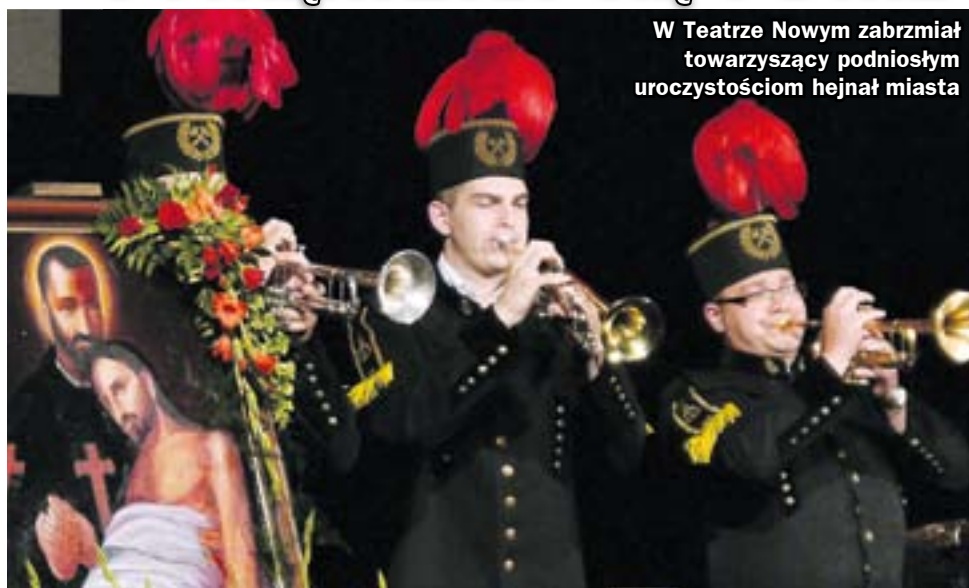
W Teatrze Nowym zabrzmiał towarzyszący podniosłym uroczystościom hejnał miasta