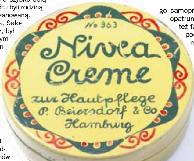
Pierwszy krem NIVEA