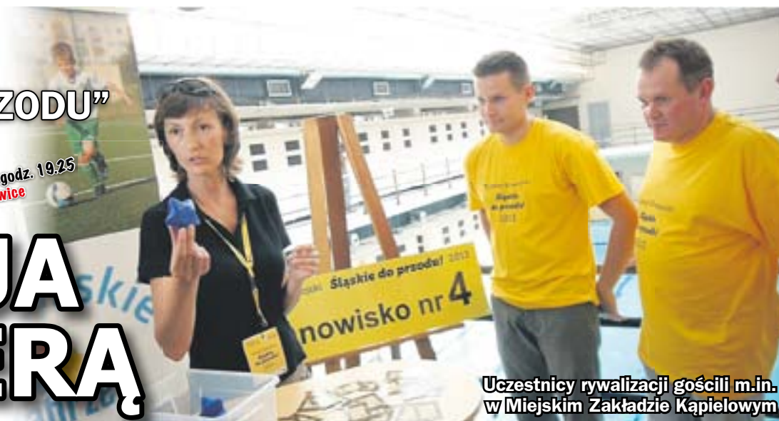
Uczestnicy rywalizacji gościli m.in. w Miejskim Zakładzie Kąpielowym

niePRZEGAPI! 4 listopada, godz. 19.25 TVP 3 Katowice