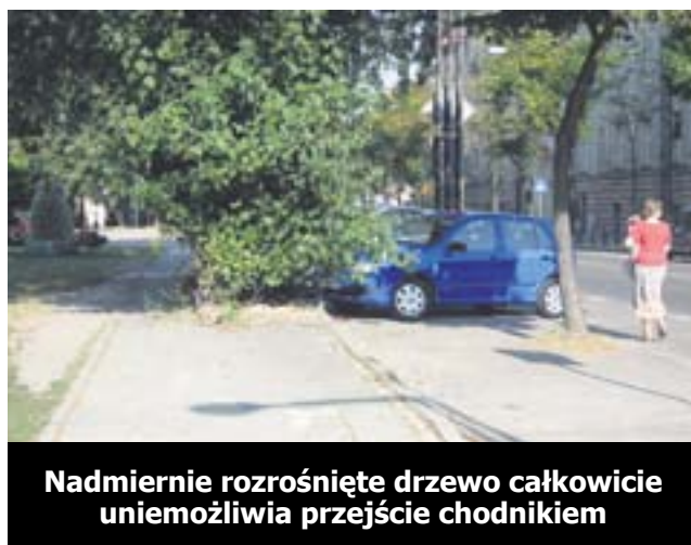
Nadmiernie rozrośnięte drzewo całkowicie uniemożliwia przejście chodnikiem