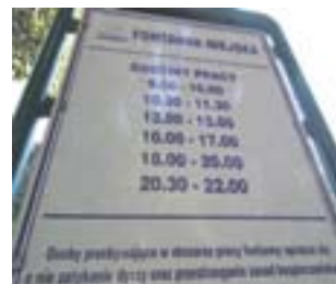
Na tabliczce przy fontannie brak informacji o braku przydatności wody do kąpieli

Latem jak bumerang, powraca temat kąpiel w miejskiej fontannie. Codziennie, szczególnie w trakcie upałów, oblegana jest