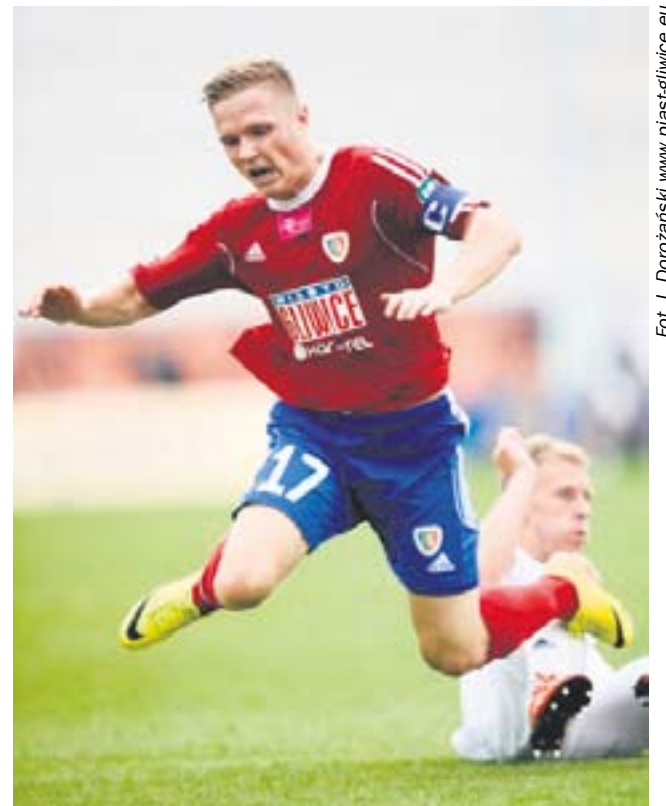
W niedzielnych derbach żaden z piłkarzy nie odstawiał nogi

z powietrza pokonał Szumskiego. Do końca tego zaciętego widowiska drużyna gości nie zdołała zagrażać bramce gospodarzy w poważniejszy sposób.