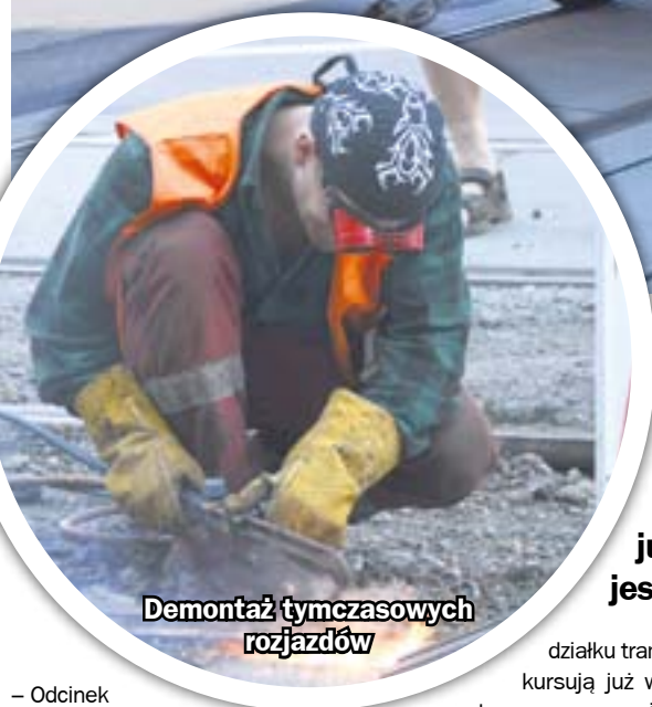
Demontaż tymczasowych rozjazdów

Nowe torowiska eliminują hałas i kołysanie wagonów