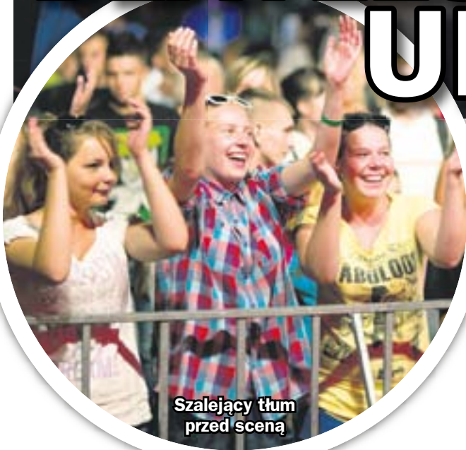
Szalejący tłum przed sceną