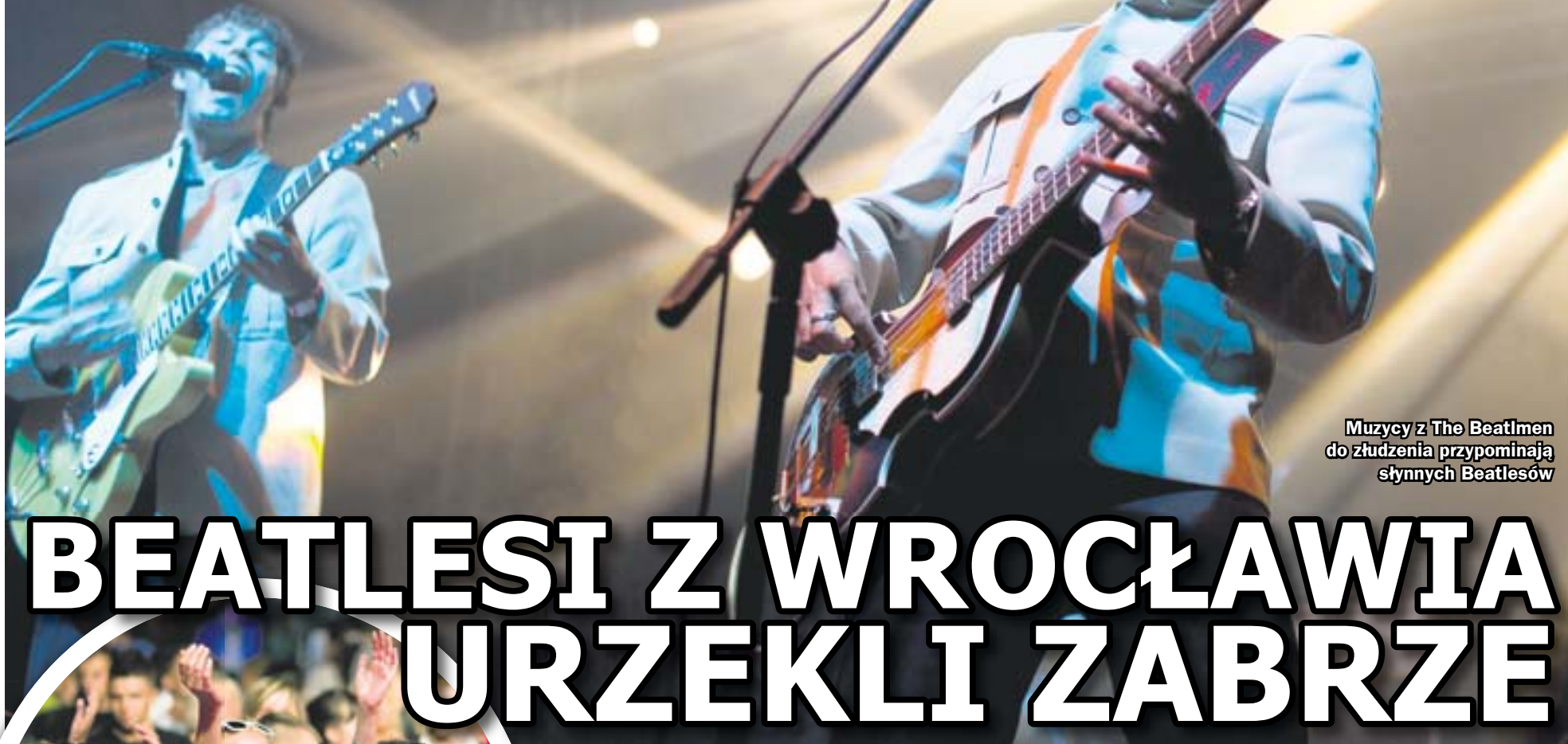
Muzycy z The Beatmen do złudzenia przypominają słynnych Beatlesów