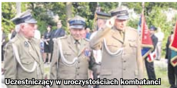
Uczestniczący w uroczystościach kombatancki

Uroczysta msza, apel poległych i występy górnicy orkiestry znalazły się w programie obchodów rocznicy powstań śląskich, które tradycyjnie zorganizowano 15 sierpnia w Kończycach. W uroczystościach wzięli udział mieszkańcy, kombatancki, przedstawiciele samorządu oraz zabrzańskich stowarzyszeń i organizacji.