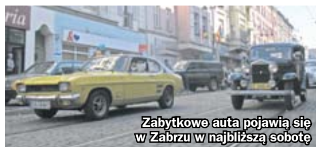
Zabytkowe auta pojawią się w Zabrzu w najbliższą sobotę

Chevrolet impala z 1969 roku, BMW 309 z 1934 i zię 111D z 1965 to tylko niektóre z kilkudziesięciu motoryzacyjnych perełek, jakie już w najbliższą sobotę będzie można zobaczyć w Zabrzu. Pokaz będzie częścią 1. Śląskiego Złotu Pojazdów Zabytkowych Old Timers Garage.