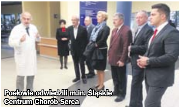
Posłowie odwiedzili m.in. Śląskie Centrum Chorób Serca