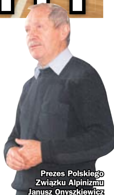
Prezes Polskiego Związku Alpinizmu Janusz Onyszkiewicz

dla nas wielka radość, że nasz tata został wybrany patronem jednej z klas – podkreślają synowie zmarłego himalaisty, którzy przekazali szkole tablicę ze zdjęciem ojca oraz jego sprzęt wspinaczkowy. W szkole mają być cyklicznie organizowane spotkania z himalaistami. Nauczyciele chcą też, by młodzież zdobywała odznakę „Każdemu Jego Everest 8848”. Została ona ustanowiona w 20. rocznicę pierwszego zimowego wejścia polskiej wyprawy na Mount Everest. Odznaka ma na celu podnoszenie kultury wędrowania, wiedzy o historii turystyki oraz bezpieczeństwa w górach. (nm)