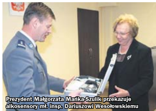
Prezydent Małgorzata Mańka-Szulik przekazuje alkosensory mł. insp. Dariuszowi Wesołowskiemu

Tylko od początku tego roku zabrzańscy policjanci skontrolowali trzeźwość ponad 65 tysięcy kierowców. Teraz kontroli będzie jeszcze więcej. A to za sprawą kolejnych urządzeń do badania trzeźwości, które w ubiegłym tygodniu trafiły do funkcjonariuszy. Nowoczesne alkosensory ufundował lokalny samorząd.