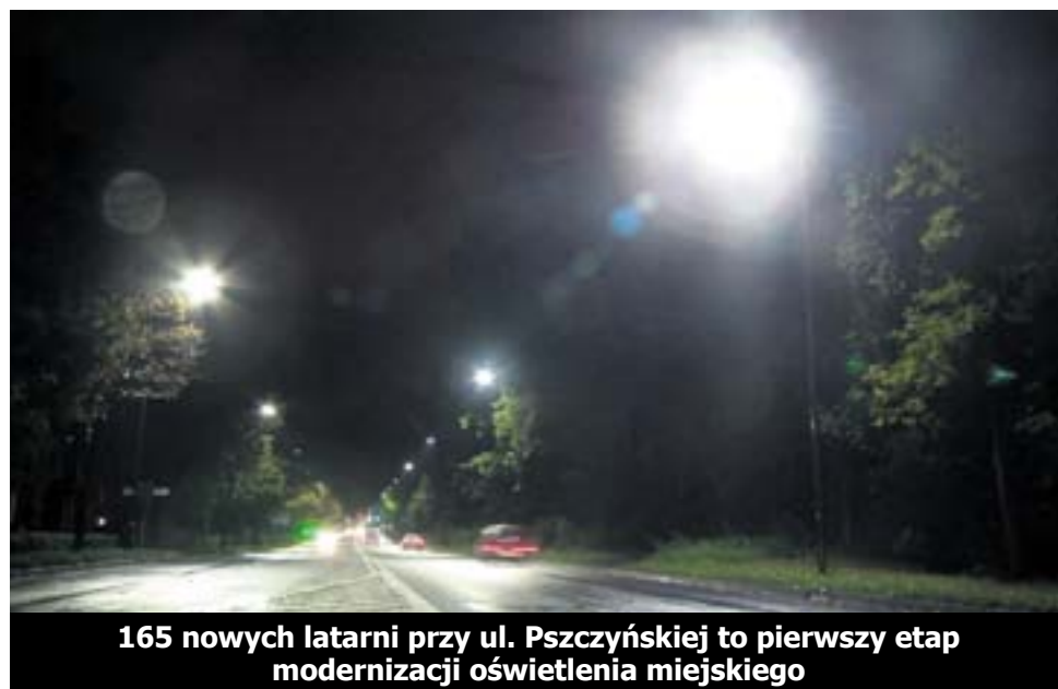
165 nowych latarni przy ul. Pszczyńskiej to pierwszy etap modernizacji oświetlenia miejskiego

Dlatego też, nie można jeszcze określić, kiedy proces wymiany oświetlenia się zakończy oraz ile będzie kosztował.