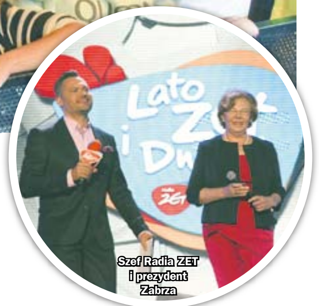
Szef Radia ZET i prezydent Zabrze