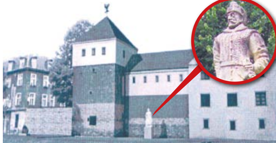
Wizualizacja przedstawiająca usytuowanie pomnika Stefana Batorego

wała pracownia Venit. Na pomnik o wysokości 4 metrów składa się 1,5-metrowy cokół i 2,5-metrowa rzeźba.