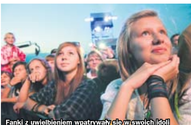
Fanki z uwielbieniem wpatrywały się w swoich idoli