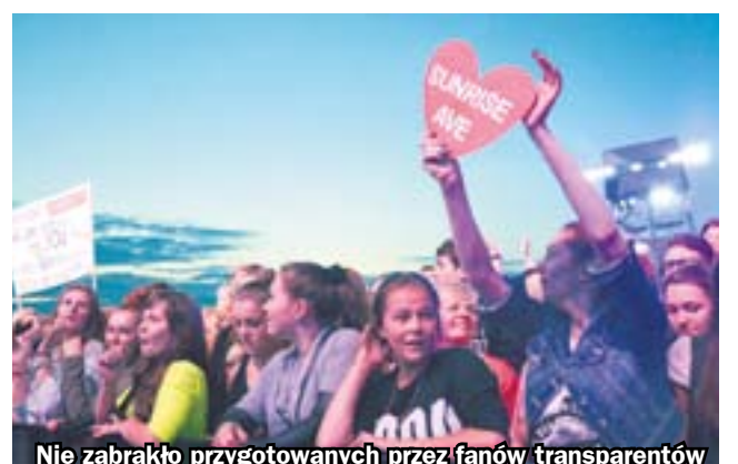
Nie zabrakło przygotowanych przez fanów transparentów