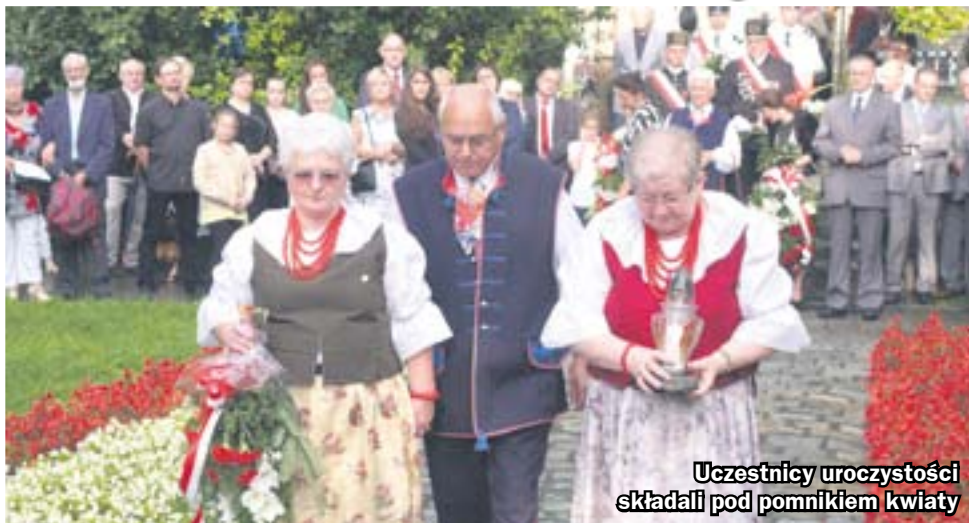
Uczestnicy uroczystości składali pod pomnikiem kwiaty