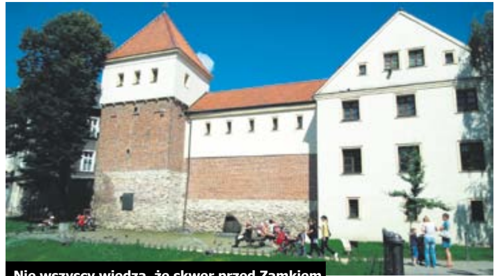
Nie wszyscy wiedzą, że skwer przed Zamkiem Piastowskim nosi nazwę Salgótarján

Śląski Konserwator Zabytków zaaprobował już projekt wzniesienia monumentu i wydał zgodę na przeprowadzenie prac budowlanych w tym miejscu. Projekt budowlano-wykonawczy zrealizo-