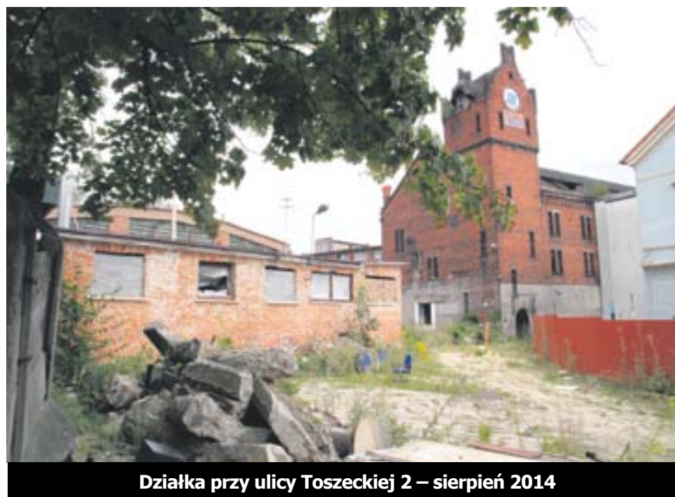
Działka przy ulicy Toszeckiej 2 – sierpień 2014