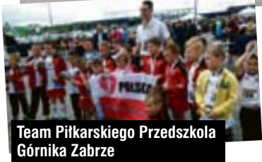
Team Piłkarskiego Przedszkola Górnika Zabrze

W biegach dla dzieci (od 2 do 16 lat) na dystansach od 100 do 1000 metrów wzięło udział 325 zawodników. W marszobiegu dla każdego na dystansie od 2 do 10 km wystartowało 547 osób. Liczne drużyny wystawiły gliwickie szkoły m.in. ZSO nr 1 i 4 oraz Gimnazjum nr 3 i 10. Najwięcej „maluszków” wystawiły Piłkarskie Przedszkole Górnika Zabrze oraz Tęczowe Przedszkole z Gieratowic.