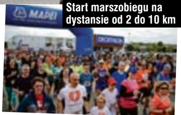
Start marszobiegu na dystansie od 2 do 10 km