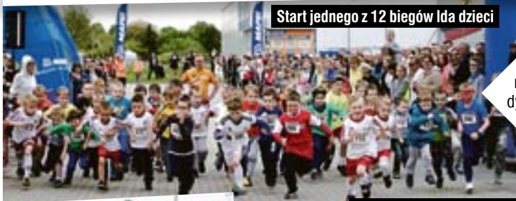
Start jednego z 12 biegów dla dzieci

8 maja w Parku Handlowym ARENA odbył się kolejny Piknik Sportowy „Biegamy z Sercem”, którego celem po raz trzeci było pozyskanie środków finansowych na zakup sprzętu rehabilitacyjnego dla niepełnosprawnej młodzieży z Zespołu Szkół im. Janusza Korczaka w Gliwicach. W akcji wzięło udział prawie 1500 osób: zawodników i kibiców, wolontariuszy i członków honorowych fundacji oraz pracowników technicznych Areny i firmy Mapei.