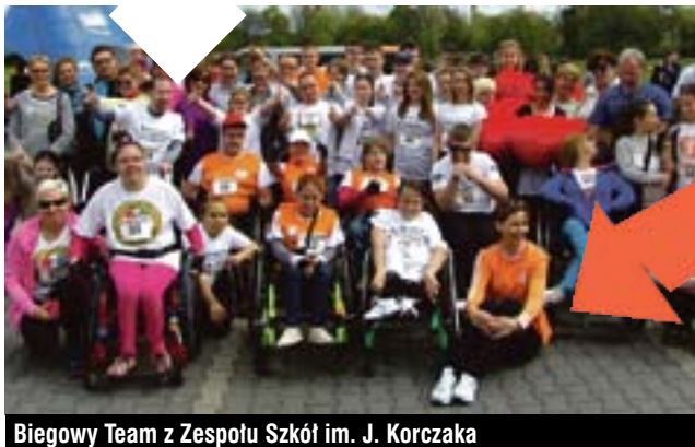
Biegowy Team z Zespołu Szkół im. J. Korczaka